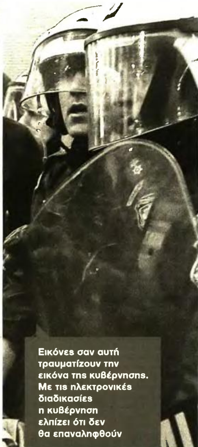
Εικόνες σαν αυτή τραυματίζουν την εικόνα της κυβέρνησης. Με τις ηλεκτρονικές διαδικασίες η κυβέρνηση ελπίζει ότι δεν θα επαναληφθούν

Η υπόθεση Μουζάλα έχει αναζωπυρώσει τα σενάρια ανασχηματισμού, που ούτως ή άλλως έχει τοποθετηθεί χρονικά από κυβερνητικά στελέχη παράλληλα με το κλείσιμο της τρίτης αξιολόγησης. Οπερ σημαίνει ότι ο Πρωθυπουργός, ο οποίος έχει την προνομία των αποφάσεων, θα πρέπει να πάρει τις αποφάσεις του το αργότερο έως τις 22 Ιανουαρίου και το Eurogroup που αναμένεται να βάλει τη σφραγίδα του στην ολοκλήρωση της τρέχουσας αξιολόγησης. Από τις αλλαγές στα πρόσωπα και την έκτασή τους εκτιμάται ότι θα «φωτογραφηθεί» και ο χρόνος των εκλογών: εάν, δηλαδή, οι αλλαγές είναι περιορισμένες, ίσως οι κάλπες να φανούν κοντά στον (πολιτικό) ορίζοντα.