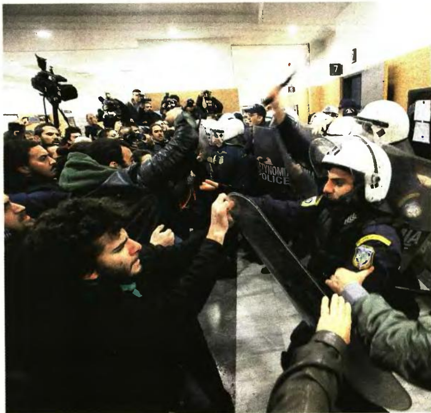
►► ΚΑΝΟΝΙΚΑ ΘΑ ΔΙΕΞΑΧΘΟΥΝ ΟΙ ΗΛΕΚΤΡΟΝΙΚΟΙ

3 Οι οφειλέτες (φυσικά και νομικά πρόσωπα) ληξιπρόθεσμων χρεών προς τις ΔΟΥ ανήλθαν συνολικά σε 4.170.753. Από τους οφειλέτες αυτούς όμως μόνο 1.718.371 είναι αυτοί στους οποίους είναι εφικτό να επιβληθούν μέτρα αναγκαστικής είσπραξης. Κι όπως προαναφέραμε η ΑΑΔΕ έχει ήδη επιβάλει αναγκαστικά μέτρα είσπραξης σε 1.014.295 οφειλέτες. ●