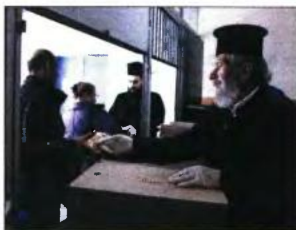
Από τα σουσούτια στην Αθήνα

φίλους για ποτό ή φαγητό, να διατηρούν αυτοκίνητο ή βαν για προσωπική χρήση, να ξοδεύουν λίγα χρήματα για τον εαυτό τους κάθε εβδομάδα, να κάνουν μία εβδομάδα διακοπές, να αντιμετωπίσουν έκτακτα έξοδα, να μην καθυστερούν την πληρωμή δανείων, ενοικίων, λογαριασμών