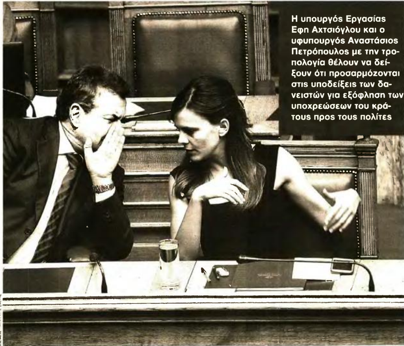
Η υπουργός Εργασίας Εφη Ακτσιόγλου και ο υφυπουργός Αναστάσιος Πετρόπουλος με την τροπολογία θέλουν να δείξουν ότι προσαρμόζονται στις υποδείξεις των δανειστών για εξόφληση των υποχρεώσεων του κράτους προς τους πολίτες