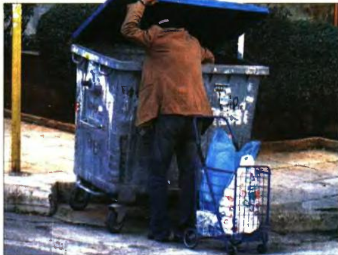
Η κυβέρνηση κάνει αναδιανομή φτώχειας δημιουργώντας περισσότερους απελπισμένους Έλληνες, εύκολα θύματα του λαϊκισμού και της πολιτικής εξαπάτησης

Τη συνέχεια τη γνωρίζουμε όλοι μας. Πήραν την εξουσία ύστερα από έναν ανταρτοπόλεμο, που συχνά κινούνταν εντός των ορίων της νομιμότητας, έκαναν αυτόν τον τραγέλαφο που τον ονόμασαν «διαπραγματεύση», έσπασαν τα μούτρα της χώρας -και όχι τα δικιά τους-, οδήγησαν την Ελλάδα σε ένα δημοψήφισμα-απάτη, έκλεισαν τις τράπεζες, υπέγραψαν το χειρότερο Μνημόνιο, υποθήκευσαν την εθνική