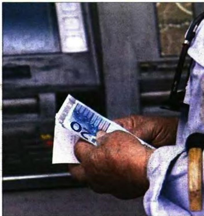
Στόχος του υπουργείου είναι το ποσό της προσωρινής να μην απέχει σημαντικά από το ποσό της οριστικής σύνταξης

Υπενθυμίζεται πως με τον νόμο Κατρούγκαλου η προσωρινή σύνταξη αντιστοιχούσε στο 50% του