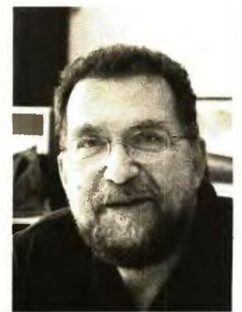
Η αύξηση των θανάτων τα επόμενα χρόνια θεωρείται αναπόφευκτη λόγω της γήρανσης του πληθυσμού, σύμφωνα με έρευνα του καθηγητή Βύρωνα Κοτζαμάνη

Το τραγικό δεν είναι μόνο ο αριθμός των θανάτων. Είναι ότι το κενό