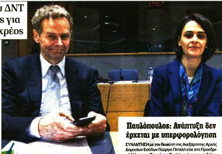
Ο επικεφαλής του ευρωπαϊκού τμήματος του ΔΝΤ Πολ Τόμσον με την επικεφαλής της τριτοκλασικής στην Ελλάδα Ντελία Βελουκίτσου

Μέλος της διοίκησης του Ταμείου χαρακτήρισε «καταθλιπτικές για την Ελλάδα» τις εκθέσεις, που, σύμφωνα με πληροφορίες, αμφισβητούν ότι μπορεί να επιτευχθεί πρωτογενές πλεόνασμα άνω του 1,5% του ΑΕΠ από το 2018 και μετά, ενώ προσεγγίζουν