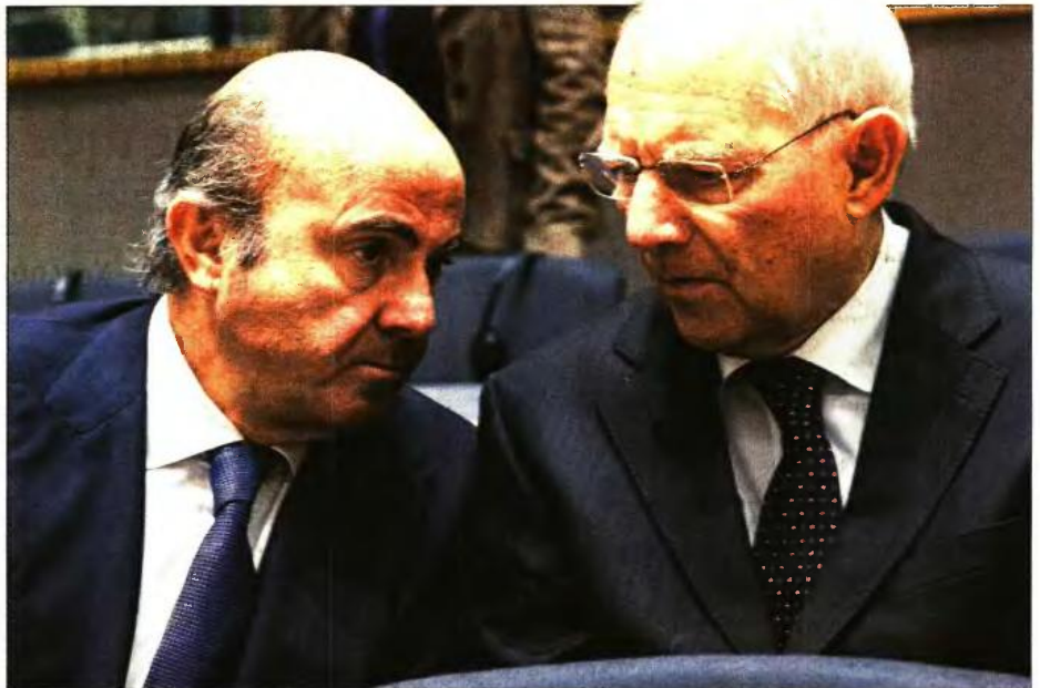
Ο Γερμανός υπουργός Οικονομικών Βόλφγκανγκ Σόιμπλε (δεξιά) με τον Ισπανό ομόλογό του Λουίς ντε Γκίντος στη χθεσινή συνεδρίαση του Eurogroup στις Βρυξέλλες

«Όλοι συμφωνούν ότι η υπεραπόδοση είναι εντυπωσιακή. Θα φτάσει στο 2% του ΑΕΠ το πρωτογενές πλεόνασμα του 2016 έναντι στόχου 0,5%» επισήμανε ο υπουργός. Πρόσθεσε δε ότι «θα υπάρξουν πρωτοβουλίες από εδώ και πέρα, για να ξεπερα-