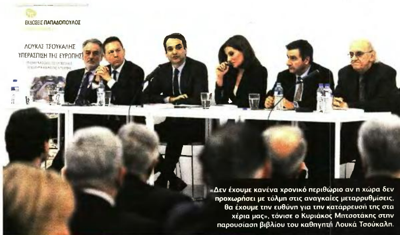
«Δεν έχουμε κανένα χρονικό περιθώριο αν η χώρα δεν προχωρήσει με τόλμη στις αναγκαίες μεταρρυθμίσεις, θα έχουμε την ευθύνη για την κατάρρευση της στα χέρια μας», τόνισε ο Κυριάκος Μητσοτάκης στην παρουσίαση βιβλίου του καθηγητή Λουκά Τσοούκαλη.