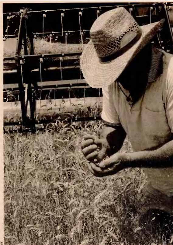
Πλέον , οι αγρότες θα καταβάλλουν εισφορές που για κύρια σύνταξη θα ανέλθουν σταδιακά, έως το 2022, στο 20% και για υγεία άμεσα στο 6,95% επί του καθαρού φορολογητέου εισοδήματός τους.

Για το 2018, το 14% γίνεται 16% για κύρια σύνταξη, με αποτέλεσμα η μικρότερη δυνατή εισφορά να υπολογίζεται στο 23,20% του εισοδήματος των 410,26 ευρώ, ήτοι 95,18 ευρώ τον μήνα. Το 2019 οι αγρότες θα κληθούν να καταβάλουν το 18% του φορολογητέου εισοδήματος για κύρια σύνταξη και συνολικά 25,20% με ελάχιστη μηνιαία εισφορά, αν έχει παραμείνει ο κατώτατος μισθός στα ίδια επίπεδα, 103,38 ευρώ. Το 2020 οι συνολικές εισφορές ανεβαίνουν στο 26,20% (19% για κύρια σύνταξη), με ελάχιστη εισφορά τα 107,48 ευρώ τον μήνα, ενώ το 2021 η εισφορά κύριας σύνταξης αυξάνεται σε 19,5% και συνολικά οι εισφορές σκαρφαλώνουν στο 26,70% με ελάχιστη μηνιαία εισφορά τα 109,54 ευρώ. Από την 1/1/2022 και μετά, το ποσοστό για κύρια ασφάλιση γίνεται 20% –όπως και όλων των υπόλοιπων ελευθέρων επαγγελματιών και αυτοαπασχολούμενων– και συνολικά 27,20%, με την ελάχιστη εισφορά να διαμορφώνεται σε 111,60 ευρώ τον μήνα. Για το τρέχον έτος, η ανώτατη εισφορά,