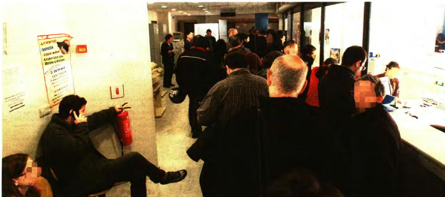
Ειδικό της κοινωνικής ασφάλισης υπολογίζουν πως οι αυξήσεις στις αγροτικές εισφορές του 2017 κυμαίνονται από 50 έως και 500 ευρώ τον μήνα