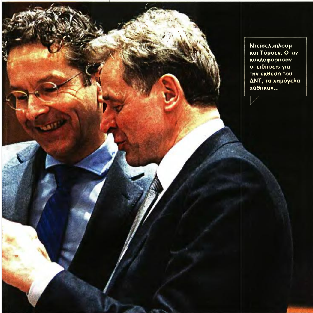
Ντσίσελμπλουμ και Τόμσεν. Όταν κυκλοφόρησαν οι ειδήσεις για την έκθεση του ΔΝΤ, τα χαμόγελα χάθηκαν...