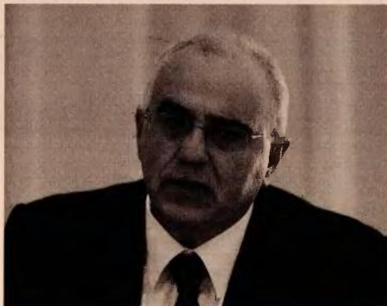
Ο πρόεδρος της Eurobank και της Ελληνικής Ένωσης Τραπεζών, Νίκος Καραμούζης.

Η διαμεσολάβηση δεν θεωρείται μόνο ταχύτερη και πιθα-