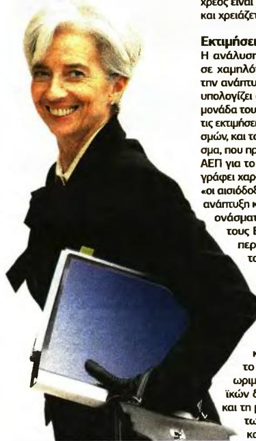
Χθες το Ταμείο προχώρησε σε μια επίδειξη δύναμης διαρρέοντας τα στοιχεία της έκθεσης για τη βιωσιμότητα του χρέους.

Η ανάλυση του ΔΝΤ βασίζεται σε χαμηλότερες εκτιμήσεις για την ανάπτυξη στην Ελλάδα, που υπολογίζει ότι θα είναι κατά μισή μονάδα του ΑΕΠ χαμηλότερα από τις εκτιμήσεις των ευρωπαϊκών θεσμών, και το πρωτογενές πλεόνασμα, που προβλέπει στο 1,5% του ΑΕΠ για το 2018 και μετά. Οπως γράφει χαρακτηριστικά η έκθεση, «οι αισιόδοξες προβλέψεις για την ανάπτυξη και τα πρωτογενή πλεονάσματα προτείνονται (από τους Ευρωπαίους) αντί της περαιτέρω ελάφρυνσης του χρέους». Το Ταμείο τονίζει την ανάγκη σημαντικά μεγαλύτερης ελάφρυνσης του χρέους, με επέκταση της περιόδου χάριτος και αναβολές καταβολής τόκων έως το 2040, επέκταση των ωρμόσεων των ευρωπαϊκών δανείων έως το 2070 και τη μείωση των επιτοκίων των δανείων του EFSF και του ESM σε επίπεδα χαμηλότερα του 1,5% για μία περίοδο 30 ετών.