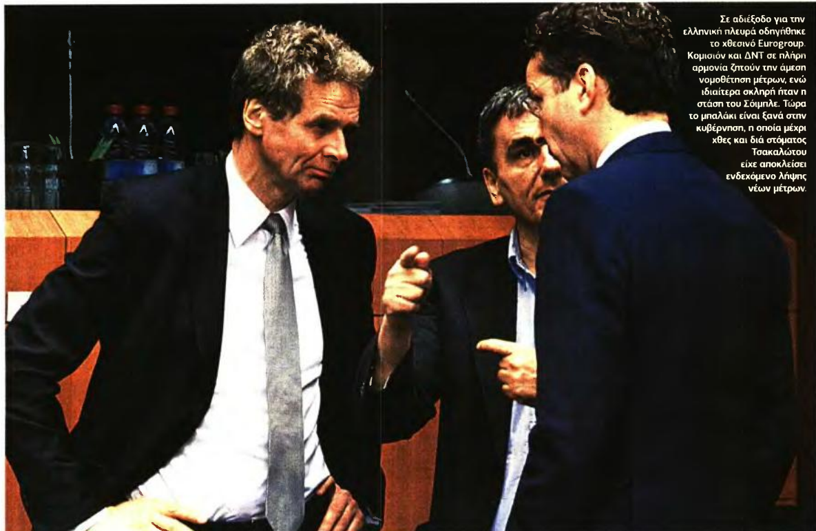
Σε αδιέξοδο για την ελληνική πλευρά οδηγήθηκε το χθεσινό Eurogroup. Κομισιόν και ΔΝΤ σε πλήρη αρμονία ζητούν την άμεση νομοθέτηση μέτρων, ενώ ιδιαίτερα σκληρή ήταν η στάση του Σόιμπλε. Τώρα το μπαλάκι είναι ξανά στην κυβέρνηση, η οποία μέχρι χθες και διά στόματος Τσακαλώτου είχε αποκλείσει ενδεχόμενο λήψης νέων μέτρων.

EUROGROUP: ΣΕ ΚΟΙΝΗ ΓΡΑΜΜΗ ΚΟΜΙΣΙΟΝ ΚΑΙ ΔΝΤ ΓΙΑ ΑΜΕΣΗ ΝΟΜΟΘΕΤΗΣΗ ΤΟΥΣ ● ΑΠΟΜΟΝΩΜΕΝΗ Η ΕΛΛΑΔΑ,