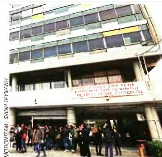
ΜΟΤΙΟΝΤΕΑΜ / ΦΑΝΗ ΤΡΥΨΑΝΗ