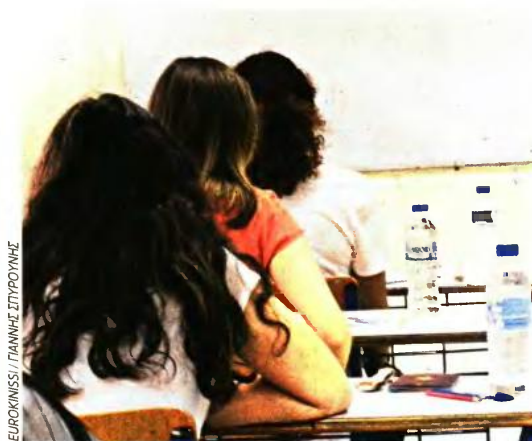
ΕΥΡΩΚΙΝΗΣΗ / ΠΑΝΩΛΗ ΣΤΡΩΤΣΗ

Οι προτάσεις του υπουργείου Παιδείας σχετικά με τις αλλαγές στο Λύκειο και τον τρόπο εισαγωγής των υποψηφίων στην τριτοβάθμια εκπαίδευση, που παρουσίασε ο υπουργός Κώστας Γαβρόγλου κατά τη διάρκεια του υπουργικού συμβουλίου της περασμένης Δευτέρας, πυροδότησαν αμέσως την αντιπαράθεση, με πολλά μέσα ενημέρωσης αλλά και αντιπολιτευόμενα κόμματα να ασκούν κριτική. Διπλοσιασμός των εξετάσεων, που εντείνουν την αγωνία και την κόπωση των μαθητών, περαιτέρω ενίσχυση της παραπαιδείας, δαπανηρό και δύσκαμπτο σύστημα είναι ορισμένες μόνο από τις πτυχές της κριτικής που ασκείται. Ο υπουργός Παιδείας, Κώστας Γαβρόγλου, μιλάει στην «Εφ.Συν.» και δίνει όλες τις απαραίτητες εξηγήσεις και απαντήσεις.