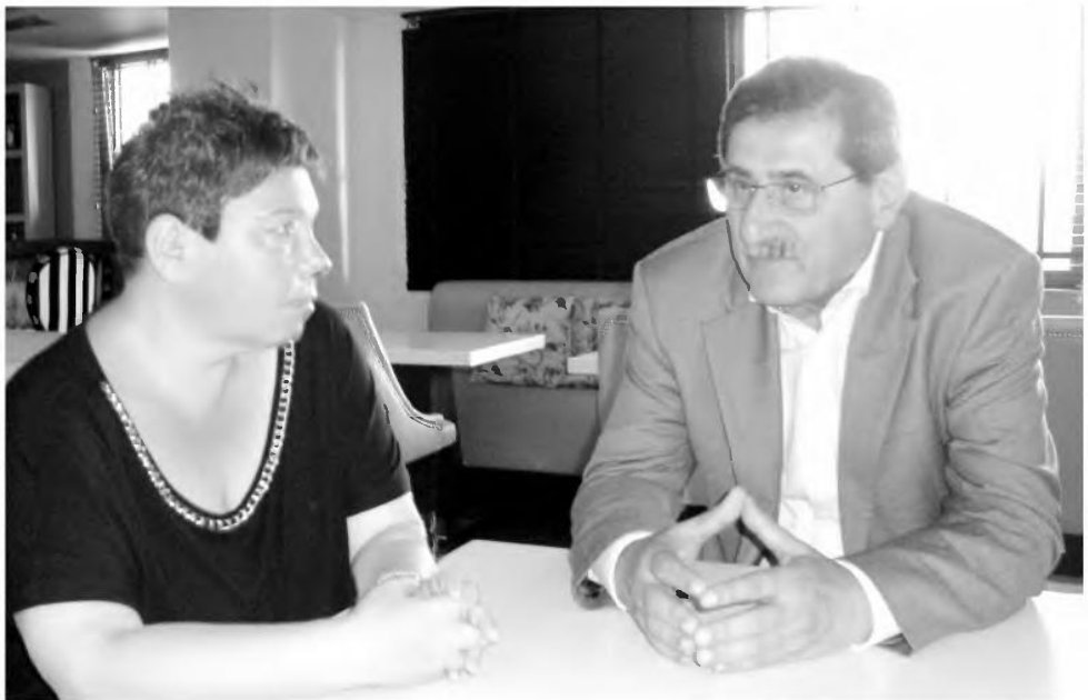
Ο Δήμαρχος Πάτρας κ. Πελετίδης μίλησε στα “Χανιώτικα νέα” για τα πολλαπλά προβλήματα του Δήμου Πατρέων και το όραμα της Δημοτικής Αρχής.

Το συμπέρασμα από τη συζήτησή μας; Ο δήμαρχος Πάτρας, ιδιαίτερα προσιτός, απλός μα πάνω απ’ όλα αγωνιστής, στέκεται με ιδιαίτερο σεβασμό απέναντι στους δημότες τους, διεκδικώντας όλα εκείνα για τα οποία τον εξέλεξαν, «πορευόμενος με πυξίδα τις ανάγκες των λαϊκών στρωμάτων», όπως ο ίδιος τονίζει.