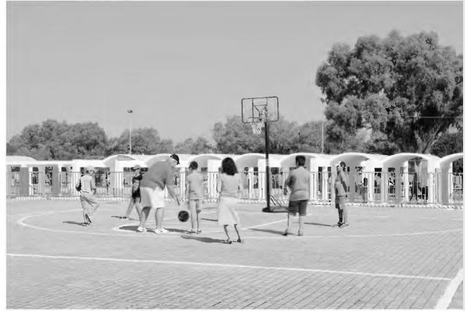
Καλοκαιρινή παιδική κατασκήνωση σε έκταση 50 στρεμμάτων στην πλαζ της Πάτρας.

ντρο καθώς και ανακατασκευή των φρεαζίων εκτροπής στην παραλία και το κέντρο της Πάτρας και επεμβάσεις στα δίκτυα αποέτευσης.