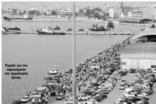
Πορεία για την παραχώρηση της παραλιακής ζώνης.

Ξεκινάμε τη λειτουργία Θερινού Κινηματογράφου, δωρεάν για το κοινό στις γει-