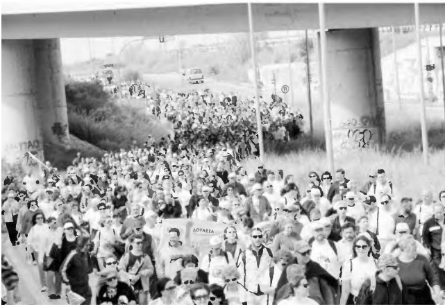
Από την πορεία κατά της ανεργίας από Πάτρα μέχρι Αθήνα με αιτήματα τη σταθερή εργασία, τη δουλειά με δικαιώματα και άμεσα μέτρα ανακούφισης των ανέργων και των οικογενειών τους.