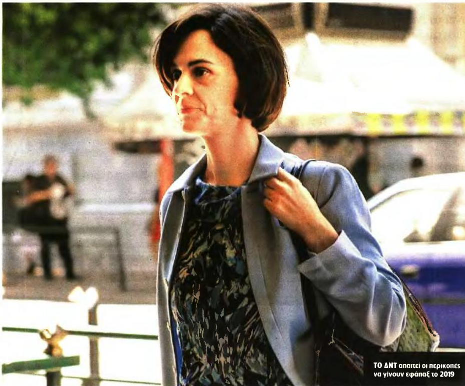
ΤΟ ΔΝΤ απαιτεί οι περικοπές να γίνουν εφάπαξ το 2019

Εως 300 ευρώ τον μήνα θα χάσουν οι συνταξιούχοι. Μείωση και του ανώτατου πλάφόν στις συντάξεις περιλαμβάνει το σκληρό πακέτο μέτρων