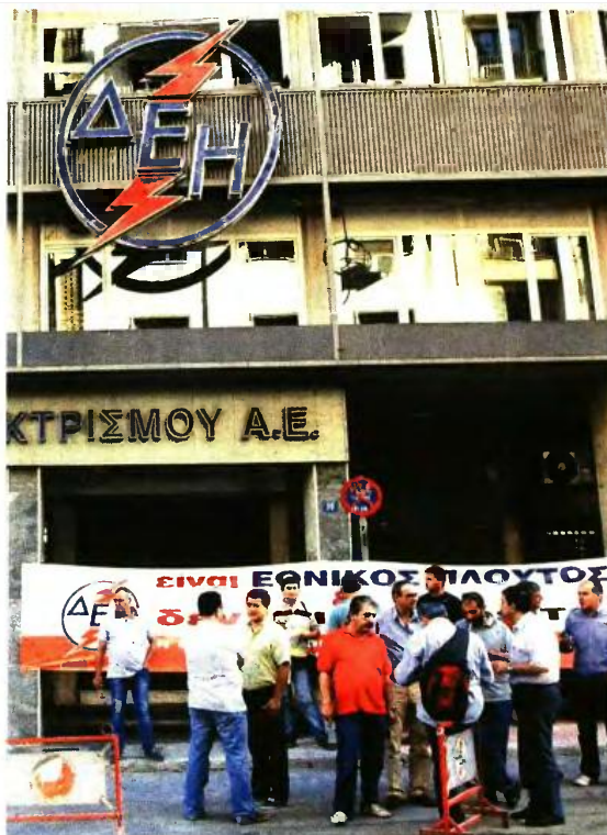
Η ΓΕΝΟΠ/ΔΕΗ υπογραμμίζει ότι μαζί με τους 18.000 εργαζομένους που εκπροσωπεί θα αγωνιστούν για να αποτρέψουν ένα «εθνικό έγκλημα»

γραμμίζει ότι μαζί με τους 18.000 εργαζομένους που εκπροσωπεί θα αγωνιστεί, όπως έκανε και το 2014, μαζί με την κοινωνία, τον κλήρο και τις κοινωνικές και επαγγελματικές οργανώσεις, για να αποτρέψει ένα «εθνικό έγκλημα».