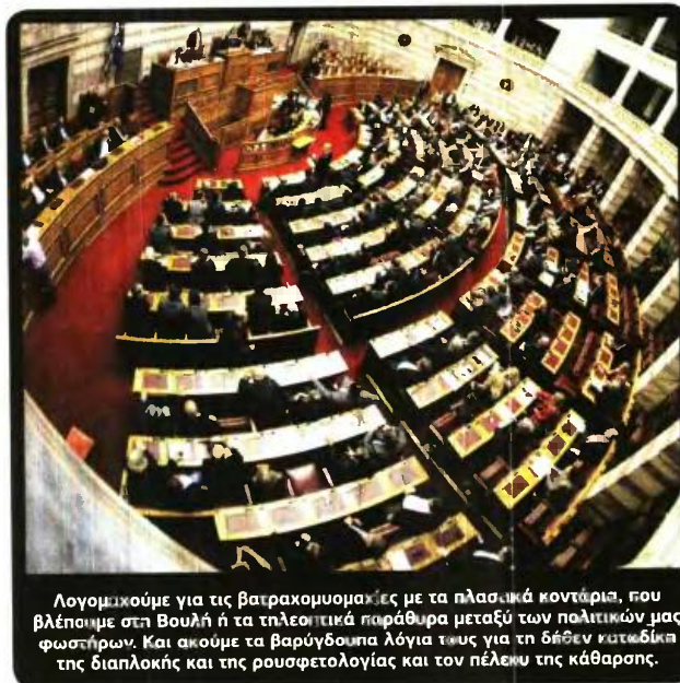
Λογομαχούμε για τις βατραχομωμαχίες με τα πλαστικά κοντάρια, που βλέπουμε στη Βουλή ή τα τηλεοπτικά παράθυρα μεταξύ των πολιτικών μας φωστήρων. Και ακόμη τα βαρύγδουπα λόγια τους για τη δήθεν κατάδικη της διαπλοκής και της ρουσφετολογίας και τον πέλεκο της κάθαρσης.

Νομιμοποιούμε διαρκώς τόσα εγκλήματα, προκειμένου να βοηθήσουμε τους κανίβαλους «εταίρους» μας στην ολοκλήρωση του εξαμβλωματικού έργου τους. Της δολοφονίας μας, δηλαδή, και της ολοσχερούς καταστροφής μας