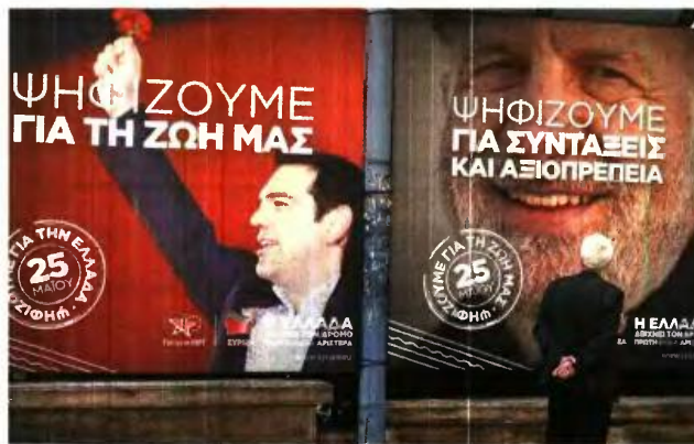
Αλλά έλεγε ο Τσίπρας για τις συντάξεις, τα ακριβώς αντίθετα υλοποιεί με το νομοσχέδιο που ψηφίζεται σήμερα

Επίσης τροποποιήθηκε (άρθρο 39) το πρωτοφανές μαθηματικό μοντέλο υπολογισμού της εισφοράς για τα μέλη των προσωπικών και ομόρρυθμων εταιρειών, που αφενός δεν έβγαζε νόημα και αφετέρου διπλασίαζε την επιβάρυνση. Έτσι, για τις εισφορές των μελών προσωπικών εταιρειών υπολογίζεται το ετήσιο εισόδημα με βάση το γινόμενο του πολλαπλασιασμού των συνολικών κερδών της εταιρείας επί του ποσοστού συμμετοχής του εκάστοτε μέλους σε αυτή.