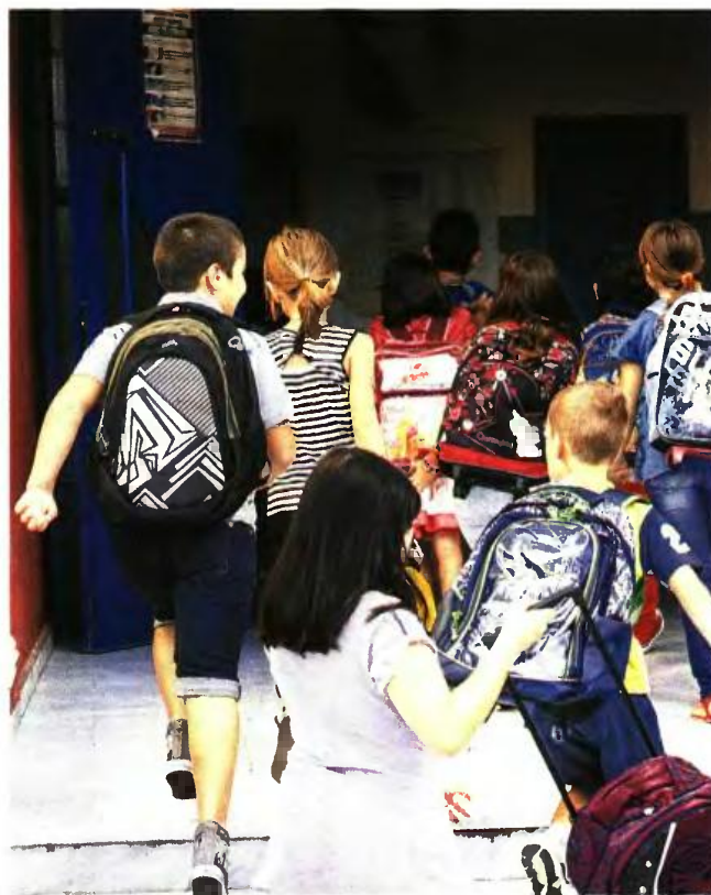
Ανέκρουσε πρόνιαν ο υπ. Παιδείας, μετά τη θύελλα αντιδράσεων που προκάλεσε ο αρχικός αποκλεισμός από τα ολοήμερα παιδιών από ευπαθείς κοινωνικά ομάδες, όπως οι άνεργοι και οι ανασφάλιστοι.

Επίθεση από 35 βουλευτές της Ν.Δ., οι οποίοι σε ερώτησή τους στη Βουλή έκαναν λόγο για οπισθοδρόμηση και εξίσωση προς τα κάτω στο θέμα των ολοήμερων, ενώ ζήτησαν στοιχεία για το πόσο εκπαιδευτικοί εξοικονομούνται αλλά και πώς θα καλυφθεί το κενό μετά την υποβάθμιση των ΕΑΕΠ. ■