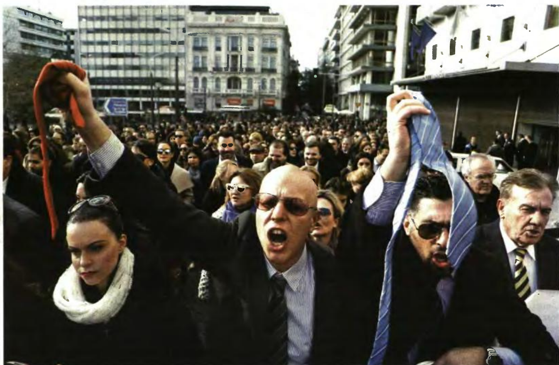
Οι επιστήμονες, από τη μεριά τους, σκληραίνουν τη στάση τους και προαναγγέλλουν κλιμάκωση των κινητοποιησέών τους

Όσοι επιλέξουν το 20% θα έχουν τη μεταβατικότητα που προβλέπεται στο νομοσχέδιο με επιπλέον παράταση, ώστε να φτάσουν σταδιακά στο 20% μετά το 2019. Η κυβέρνηση εξετάζει επίσης την πρόταση για διαπίρση της αυτονομίας του ΟΓΑ. Ο ίδιος ο υπουργός Εργασίας, Γ. Κατρούγκαλος, άφησε ανοικτό «παράθυρο» μιλώντας προ ημερών στη Βουλή για τη δημιουργία τριών Ταμείων αντί ενός που προβλέπει το προσχέδιο νόμου για την ασφαλιστική μεταρρύθμιση, προσθέτοντας ωστόσο πως ο στόχος της ισονομίας