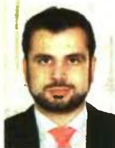
Γράφει ο Διονύσιος Ρίζος

Ετσι όσον αφορά τη δομή, φαίνεται ότι προκρίνονται η παραμονή του ΟΓΑ πλήρως ανεξάρτητου από τον ΕΦΚΑ που προβλέπει το νέο σχέδιο, αλλά και η δημιουργία Ταμείου Επαγγελματιών στο οποίο πιθανότα