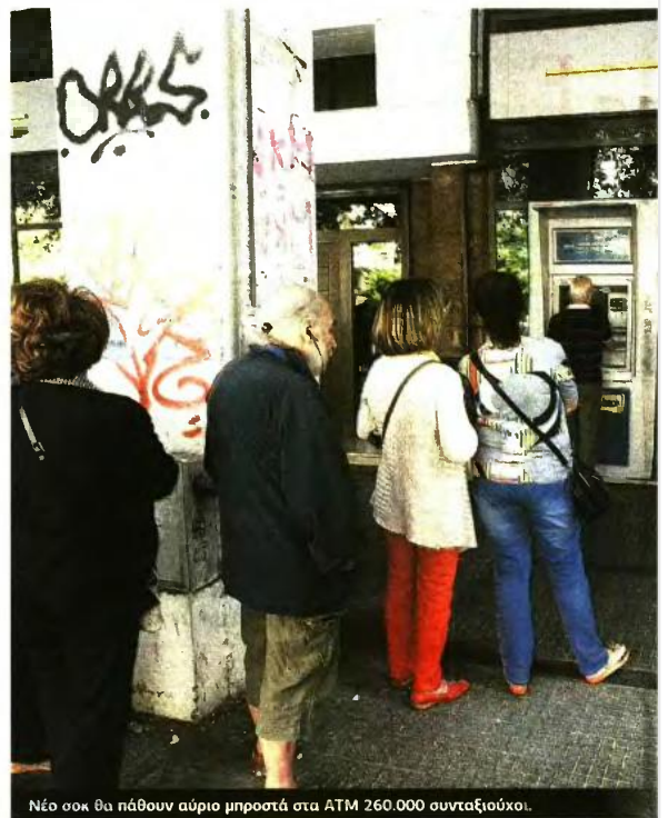
Νέο σοκ θα πάθουν αύριο μπροστά στα ΑΤΜ 260.000 συνταξιούχοι.

● Συνταξιούχος με επικουρική Δημοσίου από το ΕΤΕΑ/ΤΑΔΚΥ με αρχικά Β. Κλ. του Βασιλείου και αναπηρία 80% έπαιρνε 222,37 ευρώ. Τον Αύγουστο η επικουρική μειώθηκε στα 173,84 ευρώ (-48,53 ευρώ). Η μείωση ισχύει από 1ης Ιουνίου, δηλαδή θα της κρατηθούν αναδρομικά 48,53 ευρώ από τη σύνταξη Νοεμβρίου και άλλα 48,53 ευρώ από τη σύνταξη Δεκεμβρίου. Για αυτούς τους δύο μήνες θα παίρνει 125,31 ευρώ. ■