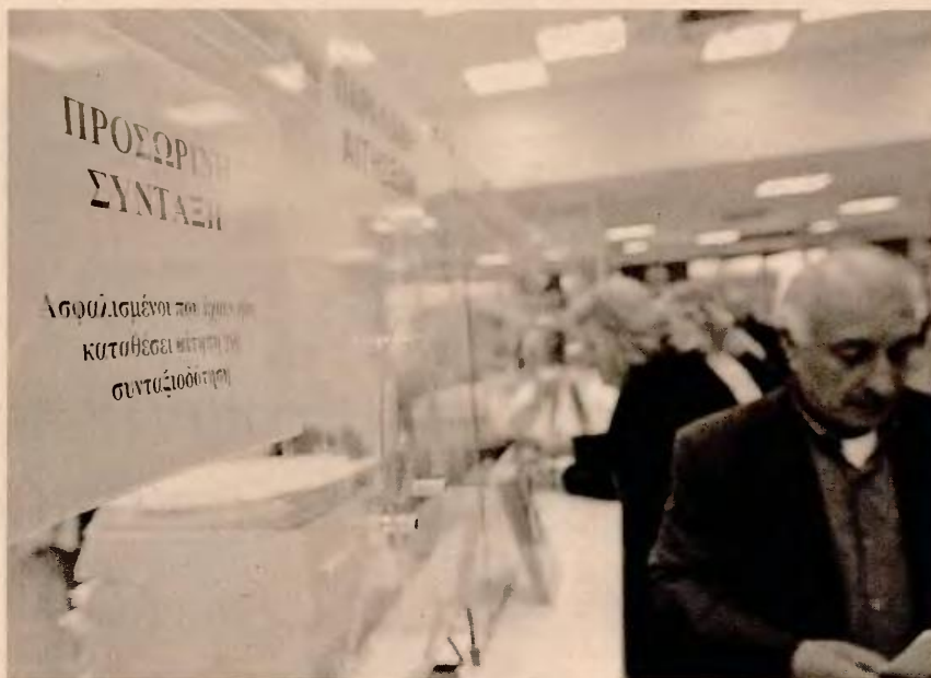
Σε όσους συνταξιοδοτηθούν έως το 2018, αν το καθαρό προ φόρου ποσό της σύνταξής τους, υπολογιζόμενο με τον νέο τρόπο, υπολείπεται σε ποσοστό άνω του 20% του καθαρού προ φόρου ποσού της σύνταξης που θα λάμβαναν με τον παλιό τρόπο υπολογισμού, θα χορηγείται ένα μέρος της προσωπικής διαφοράς.

Συγκεκριμένα, σε όσους συνταξιοδοτηθούν έως το 2018, αν το καθαρό προ φόρου ποσό της σύνταξής τους, υπολογιζόμενο με τον νέο τρόπο, υπολείπεται σε ποσοστό άνω του 20% του καθαρού προ φόρου ποσού της σύνταξης που θα λάμβαναν με τον παλιό τρόπο υπολογισμού, δηλαδή ακόμη και έπειτα από όλες τις μνημονιακές περικοπές, θα τους χορηγείται ένα μέρος της προσωπικής διαφοράς. Για το τρέχον έτος προβλέπεται η καταβολή του 33% αυτής της διαφοράς. Αντίστοιχα, όσοι φύγουν το 2018 θα λάβουν μόνο το 25%