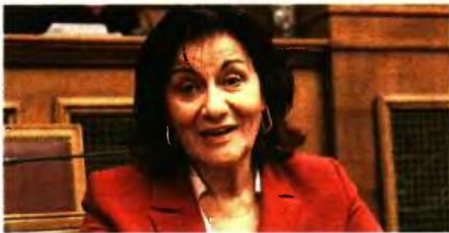
Η ΑΝΑΠΛΗΡΩΤΡΙΑ υπουργός Κοινωνικής Αλληλεγγύης, Θεανώ Φωτίου