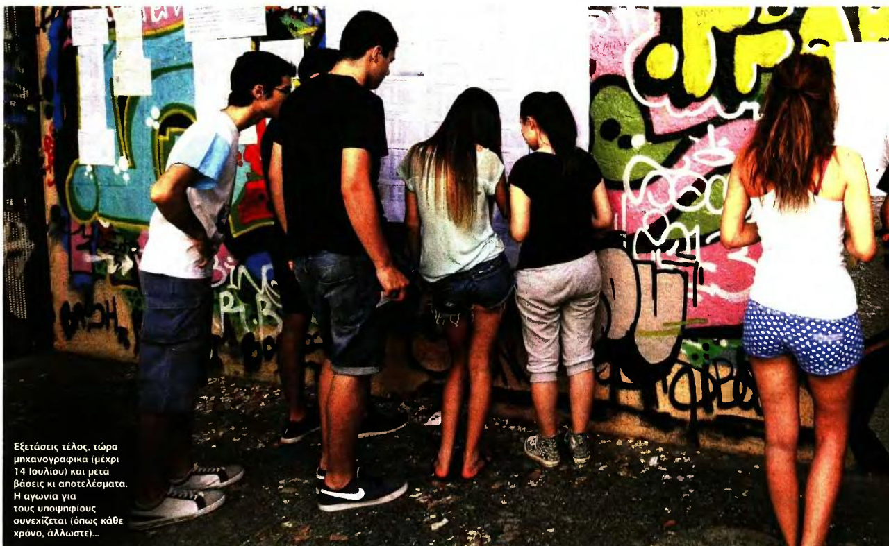
Εξετάσεις τέλος, τώρα μηχανογραφικά (μέχρι 14 Ιουλίου) και μετά βάσεις κι αποτελέσματα. Η αγωνία για τους υποψηφίους συνεχίζεται (όπως κάθε χρόνο, άλλωστε)...

ΕΙΣΑΓΩΓΗ ΣΕ ΑΕΙ-ΤΕΙ: ΣΥΝΩΣΤΙΣΜΟΣ (32.732 ΥΠΟΨΗΦΙΟΙ) ΣΤΙΣ ΣΧΟΛΕΣ ΑΝΘΡΩΠΙΣΤΙΚΩΝ ΣΠΟΥΔΩΝ ΓΙΑ ΠΟΛΥ