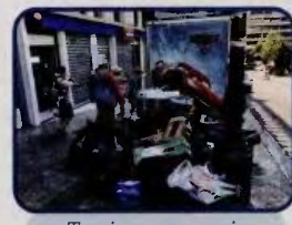
Τουρίστες περπατούν στο Σύνταγμα σε ένα περιβάλλον γεμάτο απορρίμματα.