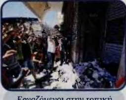
Εργαζόμενοι στην τοπική αυτοδιοίκηση προσπαθούν να σκώσουν τα ρολά του υπουργείου Εσωτερικών.