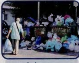
Εικόνα χάους και στους δρόμους του Ζωγράφου.