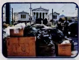
Σκουπίδια στην Πανεπιστημίου έχουν κάνει «κατάληψη» στο πεζοδρόμιο.