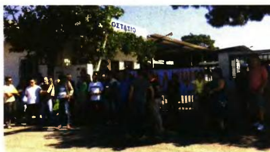
Σε κατάληψη από χθες το αμαξοστάσιο του Βόλου. Από τις πύλες πέρασε μόνο απορριμματοφόρο «ασφαλείας»

Σύμφωνα με την ίδια, ήδη ο αριθμητικός χάρτης των εργαζομένων στους