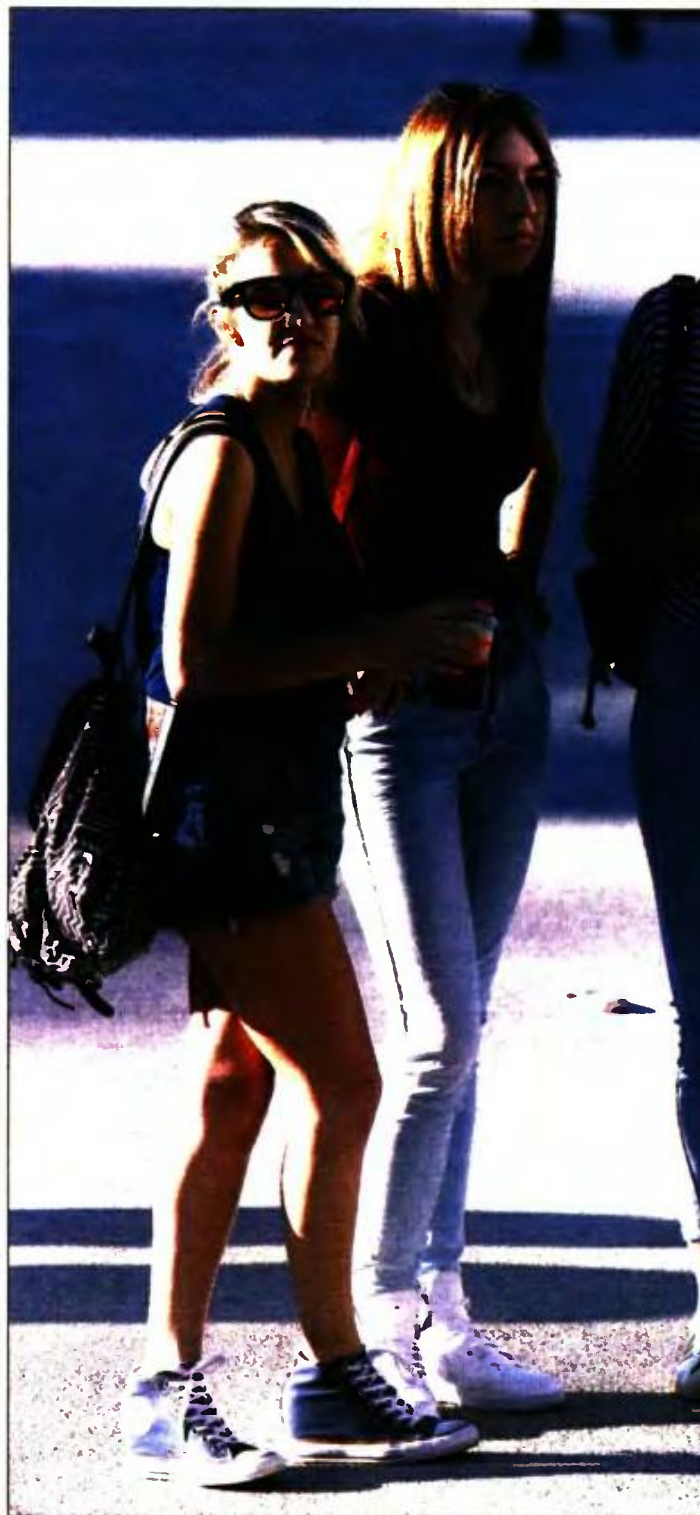
Υποψήφιοι των πανελλαδικών σε εξεταστικό κέντρο της Κυψέλης

Στις Θετικές Σπουδές 31.383 υποψήφιοι, έναντι πέρυσι 28.647, και στην Ομάδα Θετικών Σπουδών Οικονομίας και Πληροφορικής 21.793, έναντι πέρυσι 21.535. Συνολικά συμμετείχαν 85.908 υποψήφιοι, έναντι 82.895 το 2016. Αντιστοίχως καταγράφονται οι προπηθήσεις ανά ειδικότητα για 19.021 υποψηφίους των ΕΠΑ.Λ., έναντι 17.803 το 2016.