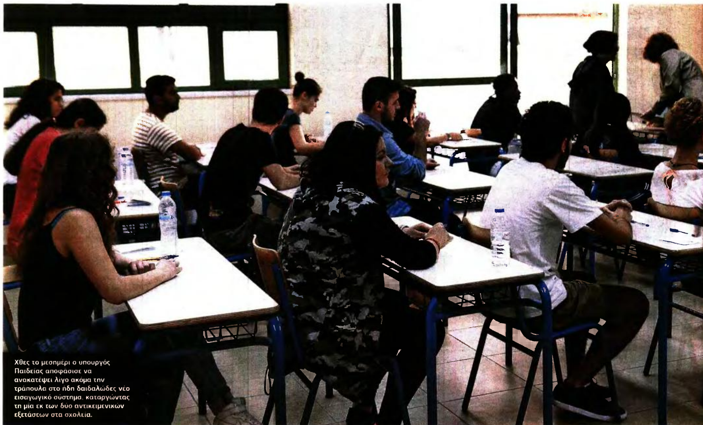
Χθες το μεσημέρι ο υπουργός Παιδείας αποφάσισε να ανακατέψει λίγο ακόμα την τράπουλα στο ήδη δαιδαλώδες νέο εισαγωγικό σύστημα, καταργώντας τη μια εκ των δύο αντικειμενικών εξετάσεων στα σχολεία.

Κ. ΓΑΒΡΟΓΛΟΥ: ΔΗΛΩΝΕΙ ΤΩΡΑ ΠΩΣ Η ΔΙΑΔΙΚΑΣΙΑ ΤΟΥ ΙΑΝΟΥΑΡΙΟΥ ΘΑ ΕΙΝΑΙ ΠΡΟΑΙΡΕΤΙΚΗ ΚΑΙ ΠΩΣ ΘΑ ΕΧΕΙ