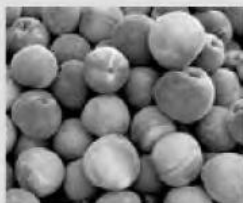
Οι διανομές θα γίνουν ως εξής:

Θα διανεμηθούν επίσης φρούτα και στα διάφορα ιδρύματα που βρίσκονται στο Δήμο.