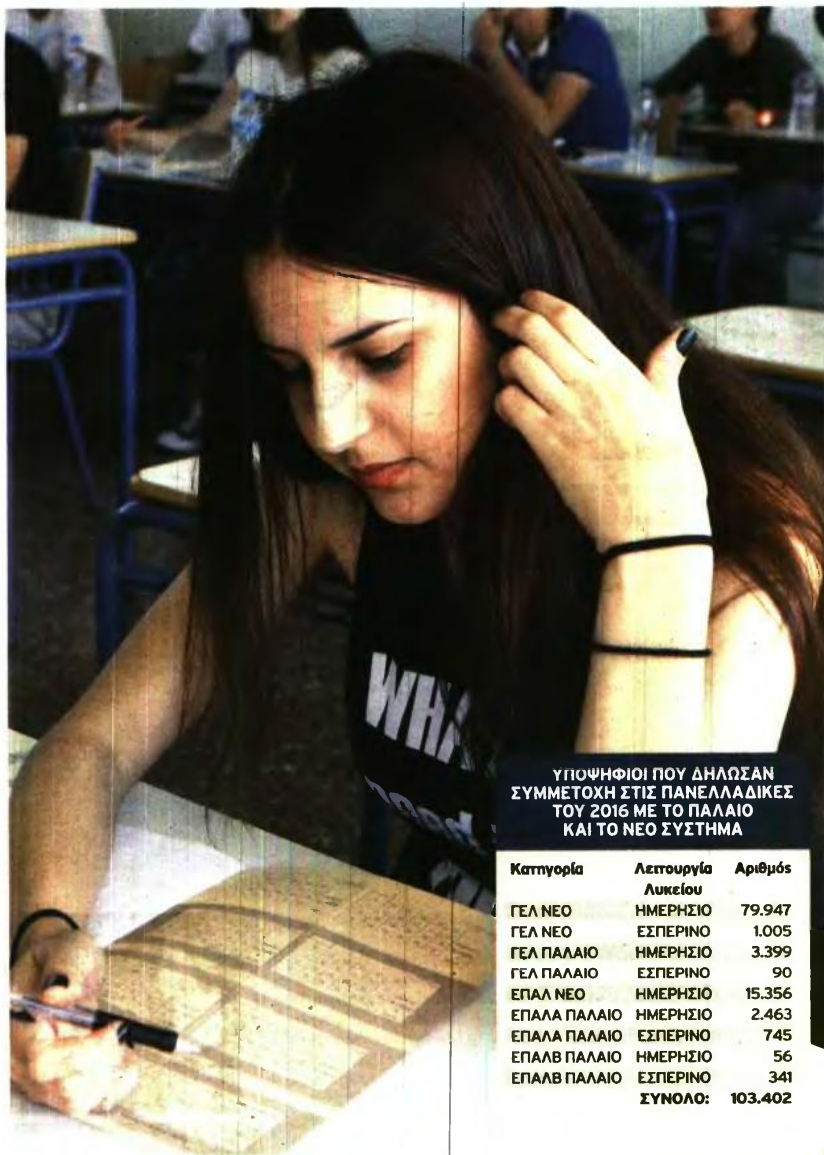
ΥΠΟΨΗΦΙΟΙ ΠΟΥ ΔΗΛΩΣΑΝ ΣΥΜΜΕΤΟΧΗ ΣΤΙΣ ΠΑΝΕΛΛΑΔΙΚΕΣ ΤΟΥ 2016 ΜΕ ΤΟ ΠΑΛΑΙΟ ΚΑΙ ΤΟ ΝΕΟ ΣΥΣΤΗΜΑ

Αρα το νέο σύστημα, έτσι όπως είναι διαμορφωμένο, βοηθάει τα παιδιά που έχουν επιτυχία στα βασικά μαθήματα να παίρνουν και την πρώτη τους επιλογή και αυτό είναι πολύ καλό σε σχέση με το παρελθόν, που μπαινανε πολλά μαθήματα μαζί και η πρώτη επιλογή μπορεί να μπλεκόταν και με άλλα δευτερευόντα μαθήματα. Οποιοσδήποτε γράφει καλά Αρχαία, Μαθηματικά και Βιολογία, θα κερδίσει και την πρώτη του επιλογή και αυτό είναι ένα θετικό του νέου συστήματος».