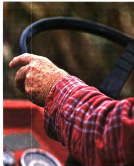
Οι γρήγορες μεταβιβάσεις σε μη συγγενικά πρόσωπα από συνταξιούχους που φοβούνται περικοπές θα ψηλώσει το Απόθεμα.

Με την ενοποίηση των φορέων κύριας ασφάλισης σε ένα υπερταμείο, το ΕΦΚΑ, θα είναι πολύ εύκολο για το κράτος να ελέγξει αν κάποιος συνταξιούχος δουλεύει