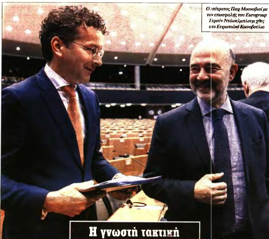
Ο επίτροπος Πιερ Μοσκοβισί με τον επικεφαλής του Eurogroup Γερούν Ντάισελμπλουμ χθες στο Ευρωπαϊκό Κοινοβούλιο