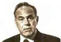
ΤΟΥ ΚΩΝΣΤΑΝΤΙΝΟΥ ΑΡΒΑΝΙΤΟΠΟΥΛΟΥ

Όλες αυτές οι προτεραιότητες προϋποθέτουν αλλαγή νοοτροπίας καθώς και έμπρακτο ενδιαφέρον της κοινωνίας και των κυβερνήσεων για τη δημόσια εκπαίδευση.