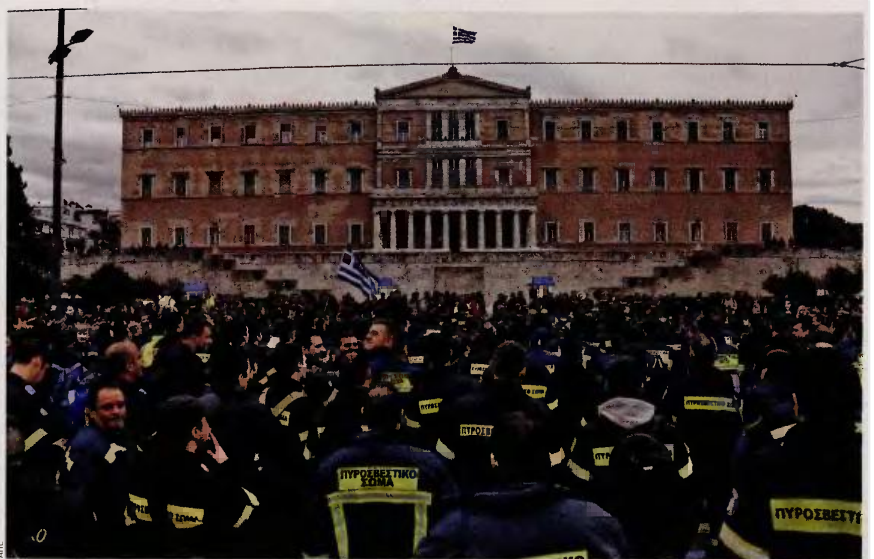
Διαμαρτυρία πυροσβεστών έξω από τη Βουλή, τον περασμένο Φεβρουάριο. Ως επικρατέστερο σενάριο φέρει η κατάρτιση νομοθετικής ρύθμισης για συγκεκριμένες κατηγορίες συμβασιούχων.

Τρεις μήνες μετά και αφού το ζήτημα των συμβασιούχων έχει αποτελέσει επανειλημμένως πεδίο σύγκρουσης στη Βουλή, με την κυβέρνηση να επαναλαμβάνει ότι η συγκεκριμένη κατηγορία εργαζομένων θα πρέπει να αποκατασταθεί, δεδομένου ότι πρόκειται για υπαλλήλους που εργάζονται χρόνια σε συγκεκριμένες θέσεις, καθώς στην πραγματικότητα καλύπτουν πάγιες και διαρκείς ανάγκες, επι-