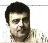
ΤΟΥ ΣΤΑΥΡΟΥ ΠΕΤΡΑΚΗ