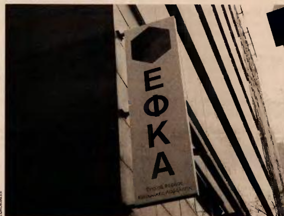
Η σχετική διάταξη του νόμου αναμένεται ως σανίδα σωτηρίας από χιλιάδες οφειλέτες, κυρίως ελεύθερους επαγγελματίες οι οποίοι έσπευσαν τους τελευταίους μήνες να καταβάλουν τις νέες εισφορές προς τον ΕΦΚΑ.

Να σημειωθεί ότι στη διαδικασία εξωδικαστικού συμβιβασμού, αν και εξαιρούνται ελεύθεροι επαγγελματίες, προβλέπεται η δυνατότητα των Ταμείων και κατά συνέπεια του ΚΕΑΟ, να προχωρούν σε διμερείς συμφωνίες, με τους όρους που προβλέπονται στον νόμο. Στη διαδικασία δύναται να ενταχθούν και χρέη κάτω των 20.000 ευρώ, ο αριθμός των δόσεων δεν μπορεί να είναι μεγαλύτερος των 120, ενώ η κατώτερη μηνιαία δόση δεν μπορεί να είναι μικρότερη