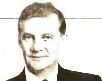
ΤΟΥ ΘΑΝΟΥ ΔΗΜΟΠΟΥΛΟΥ