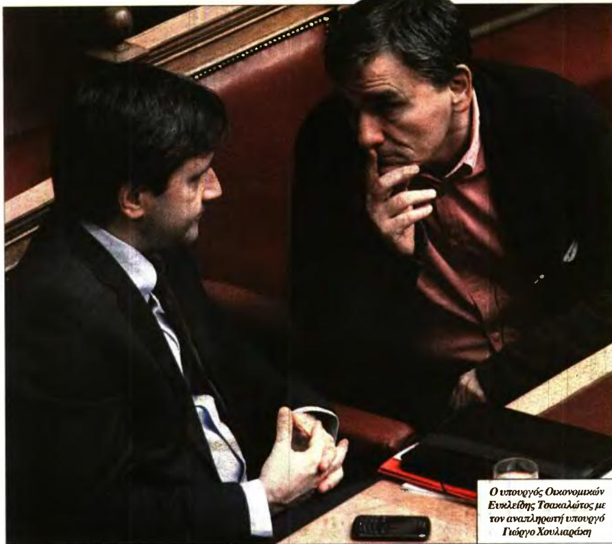
Ο υπουργός Οικονομικών Ευκλείδης Τσακαλώτος με τον αναπληρωτή υπουργό Γιώργο Χουλιαράκη

Όσον αφορά το αφορολόγητο όριο, η σημερινή έκπτωση φόρου των 1.900 ευρώ θα περιοριστεί στα 1.250 ευρώ. Η μείωση κα-