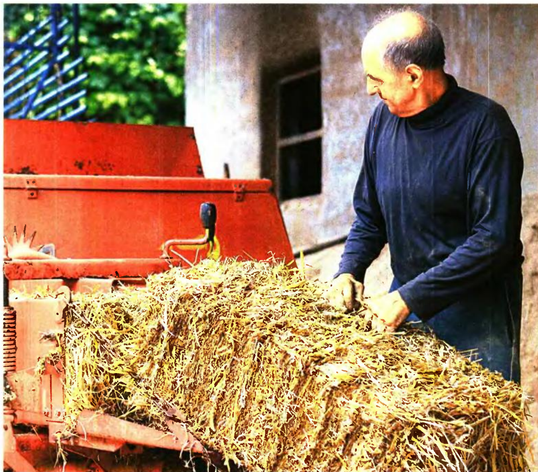
Αυτό που δεν έχουν κατανοήσει οι περισσότεροι είναι ότι το αφορολόγητο δεν είναι διαφορετικό για κάθε μορφής εισόδημα

Οι συνταξιούχοι αγρότες θεωρούνται εν δυνάμει ασφαλισμένοι στον ΟΓΑ, γι' αυτό όσοι έχουν αγροτικά εισοδήματα μεγαλύτερα από τη σύνταξη τους, θα δικαιούνται το αφορολόγητο (μεχρι βέβαια να συμπληρωθεί το οριο). Αυτό όμως που δεν έχουν κατανοήσει οι περισσότεροι είναι ότι το αφορολόγητο