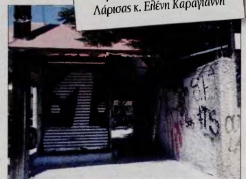
Το ένα μετά το άλλο κατεβάζουν ρολά τα περίπτερα της Λάρισας