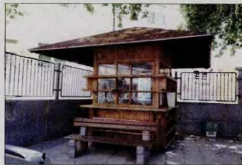
Εδώ και πολύ καιρό το περίπτερο που βρίσκεται στην πίστα ταξί του Αγίου Κωνσταντίνου είναι κλειστό. Σύμφωνα με την απόφαση του ΔΣ η συγκεκριμένη θέση καταργείται και σύντομα το κiosk θα ερμολωθεί