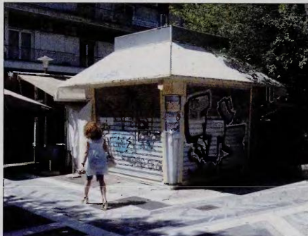
Πάνε μίνες από τότε που έκλεισε το συγκεκριμένο περίπτερο στην πλατεία Ταχυδρομείου και μέχρι σήμερα ενοικιαστής δεν βρέθηκε

Η πρόεδρος της Ένωσης Περιπτερούων Καπινοπωλών Λάρισας κ. Ελένη Καραγιάννη, με αφορμή την κλήρωση 5 περιπτερών σε ΑμεΑ και πολύτεκνους και τη δημοπράτηση άλλων 11 τον ερχόμενο Σεπτέμβριο από τον Δήμο Λαρισαίων, περιγράφει στην «Ε» τη δεινή θέση στην οποία έχουν περιέλθει οι περιπτερούχοι της πόλης τα τελευταία χρόνια. «Τα λουκέτα αδειώνονται μίνα με τον μήνα. Κάποια ίσως νοικιάσουν, κάποια άλλα δεν θα ξαναανοίξουν ποτέ. Είναι πολύ δύσκολο να κρατήσει κάποιος το περίπτερό του. Αγωνίζομαι καθημερινά από τις 6 το πρωί έως τις 2 τα επμεράματα για να βγάλω ένα μεροκάματο που πολλές φορές δεν ξεπληρώνω