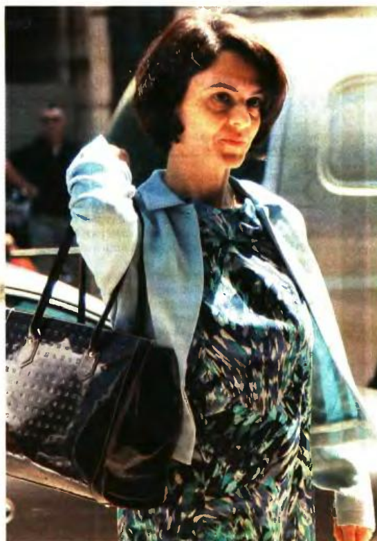
Η ΕΚΠΡΟΣΩΠΟΣ του ΔΝΤ Ντέλια Βελκουλέσκου