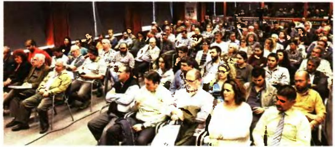
Δεκάδες συνδικαλιστές, από όλους τους κλάδους, γέμισαν την αίθουσα της ΕΣΗΕΑ

Εκτενή αποσπάσματα από την εισήγηση για το ασφαλιστικό νομοσχέδιο που έκανε ο Θανάσης Γκώγκος