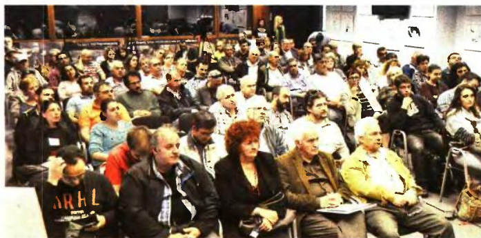
Από τη χτεσινή εκδήλωση

Το νομοσχεδίο προβλέπει ακόμα νέα κλίμακα ει-