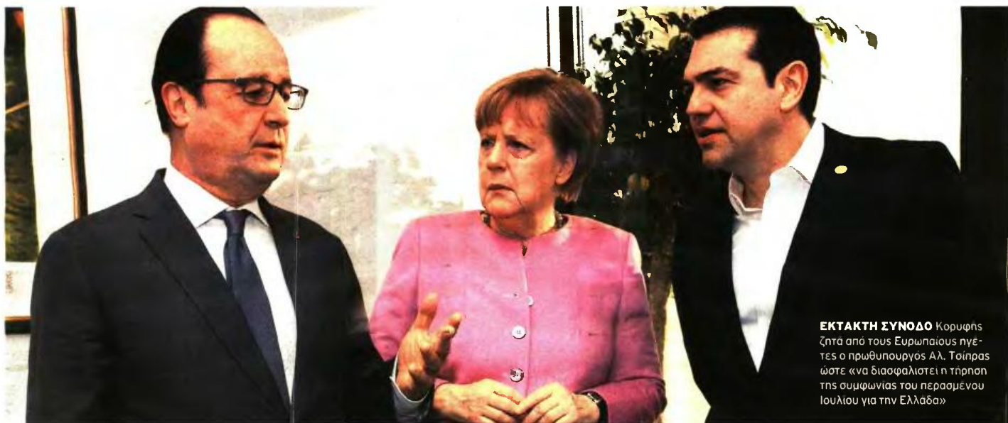
ΕΚΤΑΚΤΗ ΣΥΝΟΔΟ Κορυφής ζητά από τους Ευρωπαίους ηγέτες ο πρωθυπουργός Αλ. Τσίπρας ώστε «να διασφαλιστεί η τήρηση της συμφωνίας του περασμένου Ιουλίου για την Ελλάδα»