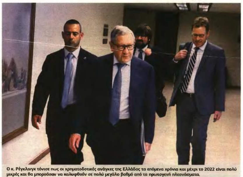
Ο κ. Ρέγκλιγκ τόνισε πως οι χρηματοδοτικές ανάγκες της Ελλάδας τα επόμενα χρόνια και μέχρι το 2022 είναι πολύ μικρές και θα μπορούσαν να καλυφθούν σε πολύ μεγάλο βαθμό από τα πρωτογενή πλεονάσματα.

Προχθές το βράδυ, μετά τη συνεδρίαση του Eurogroup, ο επικεφαλής του Ευρωπαϊκού Μηχανισμού Σταθερότητας, Κλάους Ρέγκλιγκ , είχε επισημάνει ότι η κυβέρνηση πρέπει να αναπτύξει έγκαιρα μια καλή επικοινωνιακή στρατηγική με τους επενδυτές, κάτι που έπραξαν με επιτυχία οι τρεις άλλες πρώην μνημονιακές