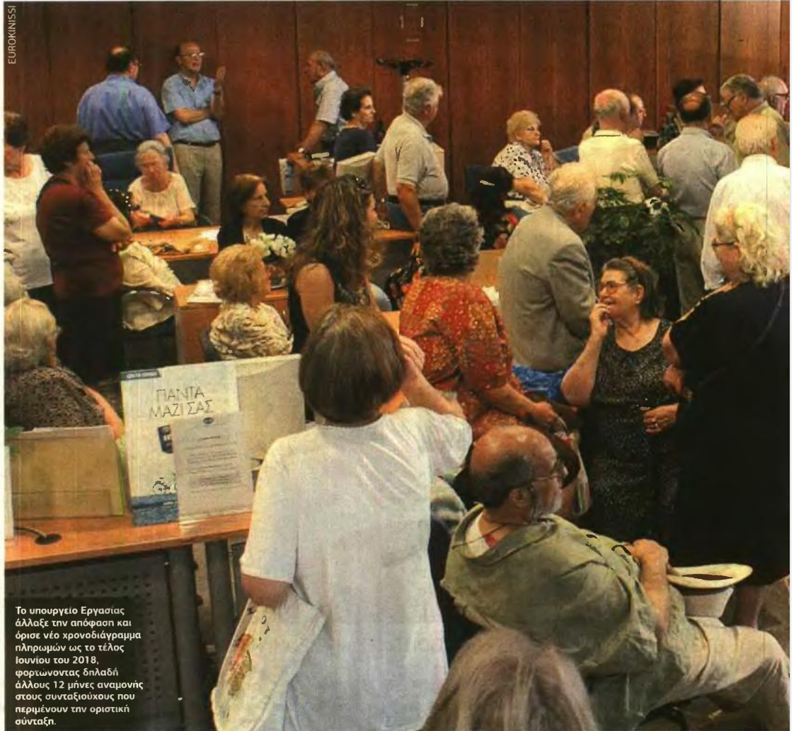
Το υπουργείο Εργασίας άλλαξε την απόφαση και όρισε νέο χρονοδιάγραμμα πληρωμών ως το τέλος Ιουνίου του 2018, φορτώνοντας δηλαδή άλλους 12 μήνες αναμονής στους συνταξιούχους που περιμένουν την οριστική σύνταξη.

Για τον σκοπό αυτό απαιτείται άμεσα η λήψη σχετικής απόφασης για τη σύσταση Κλιμακίων - Ομάδων Εργασίας στον Ε.Φ.Κ.Α. με κοινή απόφαση των Υπουργών Οικονομικών και Εργασίας, Κοινωνικής Ασφάλισης και Κοινωνικής Αλληλεγγύης. Επανυποβάλλεται τροποποιημένη η εισήγηση η οποία αφορά την 5η Τροποποίηση του Προϋπολογισμού του Ε.Φ.Κ.Α. έτους 2017 συμπληρωμένη με τη δαπάνη για τη σύσταση Κλιμακίων - Ομάδων Εργασίας στον Ε.Φ.Κ.Α.».