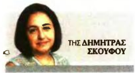
ΤΗΣ ΔΗΜΗΤΡΑΣ ΣΚΟΦΟΥ

ΑΔΕΙΑΖΕΙ ΤΟ ΚΑΛΑΘΙ. Η αδυναμία των καταναλωτών να ξεδεψούν φαίνεται καθαρά από τις πωλήσεις των σουπερμάρκετ που κινούνται ιπωτικά. Τα τελευταία στοιχεία της Ελληνικής Στατιστικής Αρχής το δείχνουν καθαρά. Ενδεικτικά, τον μήνα Μάρτιο η πώση των πωλήσεων στις κατηγορίες τρόφιμα, καπνός και ποτά έφτασε σε αξία το -11,2% και σε όγκο το -12,5%. Στοιχεία έρευνας της MRB Hellas δείχνουν ότι ενώ το 2015 η μέση μηνιαία δαπάνη στο σουπερμάρκετ ήταν 280 ευρώ, τώρα πλέον είναι 239 ευρώ. Το διαρκώς συρρικνούμενο εισόδημα εξαιτίας φόρων και περικοπών σε συνδυασμό με το γεγονός ότι πλέον ο έλληνας καταναλωτής αναζητά και προμηθεύεται τις προσφορές αποτελούν τις βασικές αιτίες για την «ελάφυνση» του καλαθίου. Σύμφωνα με την έρευνα ShopperHood Study που παρουσιάστηκε στο πλαίσιο του 12ου Συνεδρίου του ECR Hellas (συνέδρομος προμηθευτών και λιανέμπορων), πλέον οι καταναλωτές διαμόνουν πάνε λιγότερες φορές τον μήνα στο σουπερμάρκετ (εννέα έναντι 10 το 2015), αλλά ξεδεύουν και λιγότερα (26,5 ευρώ το μέσο καλάθι φέτος έναντι 28 ευρώ το 2015). Μάλιστα είναι χαρακτηριστικό ότι τσέσερεις στους 10 καταναλωτές (41,6%) είναι έτοιμοι να περικόψουν περαιτέρω δαπάνες για την αγορά προϊόντων σουπερμάρκετ εκτός τροφίμων και το 22,5% και για τρόφιμα.