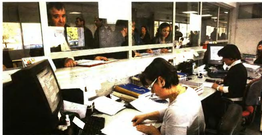
Χιλιάδες φορολογούμενοι θα αναγκαστούν να επισκεφθούν την Εφορία και άλλες υπηρεσίες για να διορθώσουν λάθη που υπάρχουν στα κρατικά αρχεία οχημάτων.

Συγκεκριμένα, έγινε διασταύρωση μεταξύ του αρχείου των κυκλοφορούντων οχημάτων του υπουργείου Οικονομικών, δηλαδή των αρχείου των οχημάτων που διαθέτουν πινακίδες, με το αρχείο των ασφαλιστικών εταιρειών που αφορά τα οχήματα που έχουν ασφαλιστεί. Από τη διασταύρωση που έγινε «φωτογραφικά» για την ημερομηνία 6 Ιουνίου 2017 προέκυψε ότι κυκλοφορούν στην Ελλάδα 1,1 εκατομμύριο ανασφάλιστα οχήματα. Πρόκειται για απίστευτο αριθμό, καθώς τα κυκλοφορούντα οχήματα υπολογίζεται ότι δεν ξεπερνούν τα 6 εκατομμύρια. Όσοι φορολογούμενοι «εντοπίστηκαν» να έχουν στην κατοχή τους ανασφάλιστο όχημα έλαβαν μήνυμα στην ηλεκτρονική τους μερίδα στο Taxisnet με το οποίο καλούνταν να προχωρήσουν στην ασφάλιση του οχήματός τους ή να διορθώσουν λάθη που τους έχουν γίνει και τους δείχνουν ανασφάλιστους.