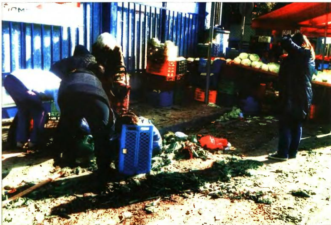
Πολίτες ψάχνουν για τρόφιμα μετά το τέλος λαϊκής αγοράς

δυσκολεύονται να αποπληρώσουν τις δόσεις πιστωτικών καρτών ή δανείων. Ειδικά στα φτωχά νοικοκυριά σχεδόν κανείς δεν μπορεί να πληρώσει, με το ποσοστό να αγγίζει το 85%!