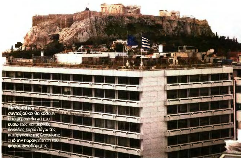
Μισθωτοί και συνταξιούχοι θα χάσουν από μερικά λεπτά του ευρώ έως και μερικές δεκάδες ευρώ λόγω της κατάργησης από την παρακράτηση του φόρου εισοδήματος.

Μισθωτοί και συνταξιούχοι θα χάσουν από μερικά λεπτά του ευρώ έως και μερικές δεκάδες ευρώ λόγω της κατά-