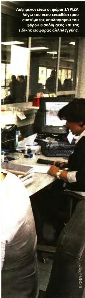
Αυξημένοι είναι οι φόροι ΣΥΡΙΖΑ λόγω του νέου επαχθέστερου συστήματος υπολογισμού του φόρου εισοδήματος και της ειδικής εισφοράς αλληλεγγύης.