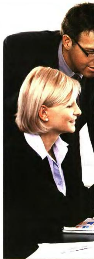
ΤΑ ΟΡΙΑ ΗΛΙΚΙΑΣ ΜΕ 35 ή 37 ΕΤΗ ΥΠΗΡΕΣΙΑΣ ΣΤΟ ΔΗΜΟΣΙΟ

Ασφαλισμένοι με 25ετία το 2012 και συνολικά 37 έτη. Το όριο ηλικίας ήταν 59 ετών μέχρι τις 18/8/2015. Από τις 19/8 και μετά αυξάνεται κατά 5 μήνες κάθε χρόνο. Ασφαλισμένη που έχει 30 έτη το 2017 και γίνεται 59 ετών μπορεί να αναγνωρίσει 5 έτη και άλλα 2 έτη από τα παιδιά, ώστε να συμπληρώσει τα 37 και να κλειδώσει σύνταξη στα 60,2. ■