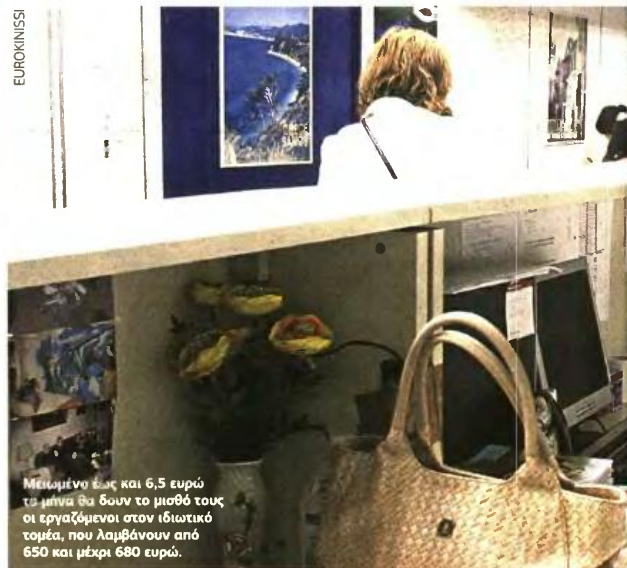
Μειωμένοι έως και 6,5 ευρώ το μήνα θα δουν το μισθό τους οι εργαζόμενοι στον ιδιωτικό τομέα, που λαμβάνουν από 650 και μέχρι 680 ευρώ.