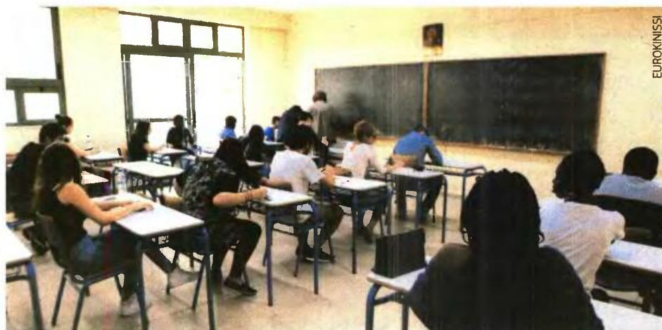
«Κουρέιους» χρόνια από το Λύκειο.

«Υπάρχει μία διασπορά Τεχνολογικών Ιδρυμάτων σε όλη τη χώρα. Κάποια από αυτά έχουν αντικείμενο που επικαλύπτονται από Πανεπιστήμια», τόνισε, χωρίς όμως, ακόμη μία φορά, να προχωρήσει σε προτάσεις ή παραδείγματα. ■