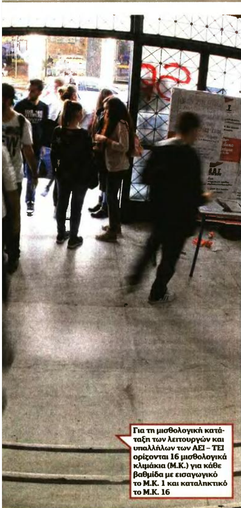
Για τη μισθολογική κατάταξη των λειτουργών και υπαλλήλων των ΑΕΙ - ΤΕΙ ορίζονται 16 μισθολογικά κλιμάκια (Μ.Κ.) για κάθε βαθμίδα με εισαγωγικό το Μ.Κ. 1 και καταληκτικό το Μ.Κ. 16