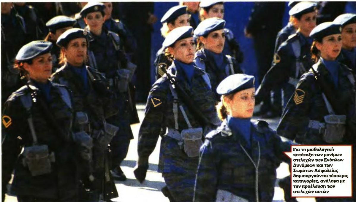
Για τη μισθολογική κατάταξη των μονίμων στελεχών των Ενόπλων Δυνάμεων και των Σωμάτων Ασφαλείας δημιουργούνται τέσσερις κατηγορίες, ανάλογα με την προέλευση των στελεχών αυτών

Διατηρείται ένα τουλάχιστον επίδομα ως ειδικών καθηκόντων