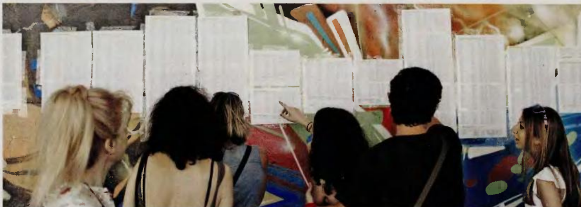
Τέλος στην αγωνία των τελειοφίτων και αποφοίτων λυκείου που συμμετείχαν στις Πανελλαδικές, οι οποίοι πρέπει τώρα να συμπληρώσουν το μηχανογραφικό τους δελτίο.

Σε ένα ακόμη... μάθημα –και ιδιαίτερα δύσκολο– θα «εξεταστούν» οι υποψήφιοι για να πετύχουν και ΤΕΙ. Πρόκειται για την υποβολή του μηχανογραφικού δελτίου, με αποκλειστική προθεσμία έως την Παρασκευή 8 Ιουλίου. Φέτος, πρώτη χρονιά εφαρμογής του νέου συστήματος, οι υποψήφιοι που επέλεξαν να εξεταστούν σε τέσσερα μόνο μαθήματα θα μπορούν να δηλώσουν τις σχολές ενός μόνο πεδίου, ενώ τις σχολές και ενός δεύτερου πεδίου μπορούν να δηλώσουν όσοι εξετάστηκαν σε πένμπτο μάθημα. Ωστόσο, παρότι η αρμόδια αναπληρώτρια υπουργός Παιδείας, Σία Ανυφαντοπούλου, είχε κάνει λόγο για αλλαγές στο σύστημα μετεγγραφών, τελικά δεν υπάρχουν και ο αριθμός των μετεγγραφομένων σε κάθε τμήμα ΑΕΙ/ΤΕΙ θα είναι ίσος με το 15% του αριθμού εισακτέων του τμήματος. Έτσι, οι υποψήφιοι πρέπει να είναι προσεκτικοί, λαμβάνοντας υπόψη ότι θα έχουν στη διάθεσή τους λιγότερες σχολές (ενδεικτικά, το 4ο πεδίο των επιστημών εκπαίδευσης έχει 22 αποκλειστικά τμήματα και αλλά 15 κοινά με άλλα πεδία) και τον «κόψιμο» στις μετεγγραφές. Οι υποψήφιοι πρέπει να απευθυνθούν στο λυκείο τους για να αποκτήσουν κωδικό (password), με τον οποίο μπορούν να επισκεπτόνται τη διεύθυνση http://exams.it.minedu.gov.gr , προκειμένου να μελετούν το πρότυπο μηχανογραφικό και να κάνουν σχέδια πριν από την οριστικοποίηση του μηχανογραφικού τους δελτίου.