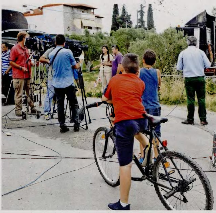
Εκπληκτική η τοπική κοινωνία αλλά και όλη η Ελλάδα παρακολουθούν τις εξελίξεις γύρω από τη δολοφονία στη Γέφυρα Θεσσαλονίκης.