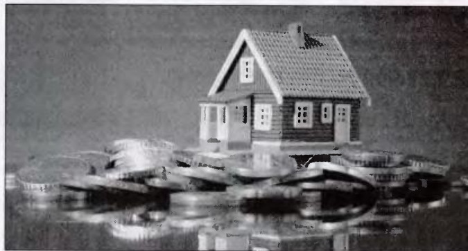
Όταν στερηθεί κάποιος της ιδιοκτησίας του, ανεξάρτητα αν είναι μεγάλη ή μικρή, αυτό θα έχει γίνει και μόνον σε καθεστώς υποτέλειας του ελληνικού κράτους

Μ Ε ΜΙΑ ΨΥΧΡΑΙΜΗ ματιά, παρατηρούμε ορισμένες παραμέτρους του ψηφιοσθέντος πολυνομοσχεδίου: α) Η για πολλούς παράνομη διαδικασία των πλειστηριασμών, δεν θα εμποδίζεται πλέον, από το ολοένα και αυξανόμενο κίνημα αντίδρασης, για τον απλούστατο λόγο ότι θα είναι ηλεκτρονικοί. Παράλληλα οι Έλληνες πολίτες υπό τη δαμόκλειο σπάθη του νέου "ιδιώνυμου" θα τρομοκρατούνται καθώς θα αντιμετωπίζουν πονέες φυλάκισης και υπό καθεστώ σοκ, θα εκδιώχνονται από την ιδιωτική τους περιουσία, για την οποία γενιές και γενιές έχουν φορολογηθεί πολλάκις. β) Με την υποχρεωτική διαμεσολάβηση στις εργατικές διαφορές, αποθαρρύνεται το δικαίωμα διεκδίκησης δια μέσου της δικαστικής οδού, αφού πλέον η δικαιοσύνη εκτός από άδικη γίνεται και απρόσιτη, γ) Το δικαίωμα στην απεργία καταστρατηγείται, δ) Επιβάλλεται ένα νέο είδος καπιταλισμού, ο λεγόμενος καζινο-καπιταλισμός, ε) Ενώ η οικογένεια και ο οικογενειακός προϋπολογισμός βρίσκεται πλέον υπό κατάρρευση και η κοινωνία σε αποσύνθεση, απομειώνονται τα οικογενειακά επιδόματα σε πολύτεκνες οικογένειες, ακριβώς σε μια περίοδο που το δημογραφικό πρόβλημα οξύνεται. Και όλα αυτά στο όνομα ενός ελληνικού χρέους, το οποίο επουδενί δεν είναι υπεύθυνος ο ελληνικός λαός και το οποίο δεν αποπληρώνεται όσοι αιώνες κι αν περάσουν. Στο πλαίσιο αυτό, περιουσίες ιδιωτικές και δημόσιες μαζί με δικαιώματα που κατακτήθηκαν με αγώνες, στερήσεις και θυσίες βγαίνουν πλέον όλα στο σφυρί! Όμως, σύμφωνα με το Σύνταγμα (Σ. άρθρο 17) κανένας δεν στερείται της