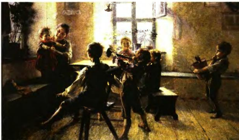
Γεώργιος Ιακωβίδης, «Παιδική συναυλία», 1900

Ο γράφων είμαι πολύτεκνος με τέσσερα μεγάλα πλέον παιδιά που δεν έτυχα αυτού του «ευεργετήματος». Αντίθετα σήμερα (εγώ, ο συμπαθών - το ομολογώ - την ακοιλουθούμενη κυβερνητική πολιτική στο θέμα) τα δύο από τα παιδιά μου με δύο μεταπτυχιακά το καθένα, έμειναν άνεργα, το ένα επί τρία χρόνια και το έτερο εξακολουθεί να είναι άνεργο και τρώφιμο στην οικογενειακή στέγη... Άσ είναι.