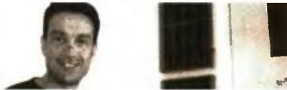
Του Γιώργου Λαμπράκη

Ο πως αναμενόταν, η συγκυβέρνηση δεν έκανε πίσω τελικά ως προς την υλοποίηση κάποιων διορθωτικών παρεμβάσεων, σε ό,τι αφορά στα σκληρά μέτρα του πολυνομοσχεδίου που ψηφίστηκε με αυξημένη μάλιστα κοινοβουλευτική πλειοψηφία το βράδυ της Δευτέρας. Έτσι λοιπόν, οι κοινωνικές ομάδες που θα υποστούν το επόμενο διάστημα τις συνέπειες αυτών των επιλογών, ετοιμάζονται να απαντήσουν στην κυβερνητική αδιαλλαξία, με πρώτους τους συλλόγους τριτεκνών και πολυτέκνων, που θα στερηθούν ένα σημαντικό μέρος των χορηγούμενων οικογενειακών επιδομάτων, καθώς θεσπίστηκαν εισοδηματικά κριτήρια.