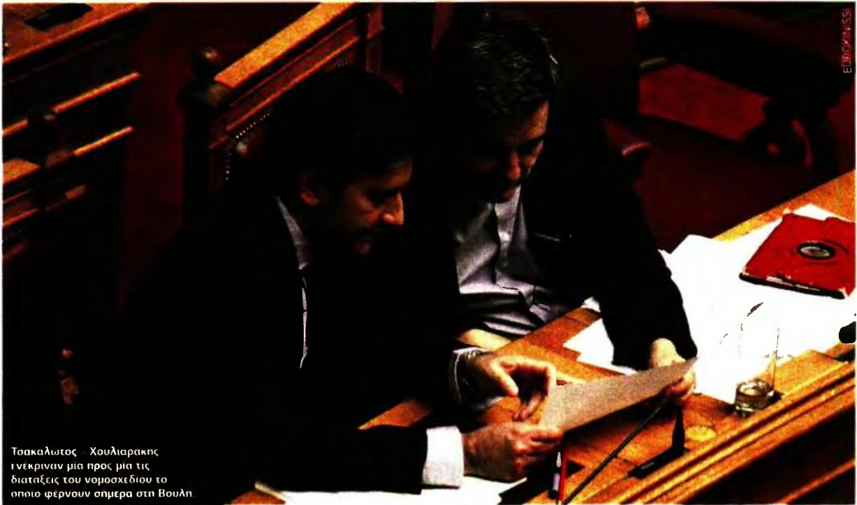
Τσακαλώτος - Χουλιαράκης ενέκριναν μια προς μία τις διατάξεις του νομοσχεδίου το οποίο φέρνουν σήμερα στη Βουλή

ΤΟ ΠΟΛΥΝΟΜΟΣΧΕΔΙΟ - ΣΚΟΥΠΑ ΘΑ ΠΡΕΠΕΙ ΝΑ ΨΗΦΙΣΤΕΙ ΜΕΧΡΙ ΤΙΣ 15 ΙΑΝΟΥΑΡΙΟΥ