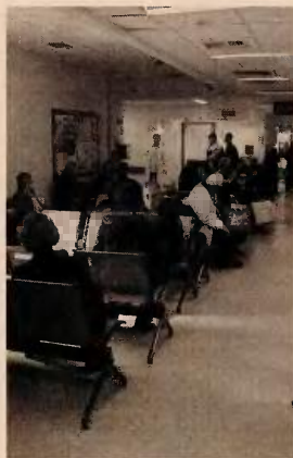
Οι ληξιπρόθεσμες οφειλές των νοσοκομείων ανήλθαν τον Ιανουάριο σε 1,02 δισ. ευρώ.

Σύμφωνα με τα στοιχεία, οι ληξιπρόθεσμες οφειλές των Οργανισμών Κοινωνικής Ασφάλισης ανήλθαν τον Ιανουάριο σε 2,819 δισ. ευρώ έναντι 2,765 δισ. ευρώ τον Δεκέμβριο, της Τοπικής Αυτοδιοίκησης σε 283 εκατ. ευρώ