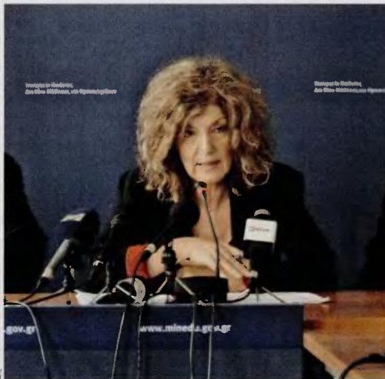
Η απόφαση της κ. Αναγνωστοπούλου εξελίχθηκε και ως «αντίδορο» προς τα ΤΕΙ, που διαμαρτυρήθηκαν για τον μικρό αριθμό διορισμών.

Η απόφαση ανήκει στην αρμόδια για την τριτοβάθμια εκπαίδευση αναπληρώτρια υπουργό Παιδείας Σία Αναγνωστοπούλου και θεωρείται ότι προωθείται στην παρούσα συγκυρία (και) ως «αντίδορο» προς τα ΤΕΙ, τα οποία διαμαρτυρήθηκαν έντονα επειδή από τους 500 διορισμούς καθηγητών που εξαγγέλθηκαν για το 2016-2017, τα πανεπιστήμια θα πάρουν 364 και τα ΤΕΙ 136. Σύμφωνα με τα στοιχεία του υπουργείου Παιδείας, σήμερα στα ΤΕΙ σπουδάζουν 139.722 φοιτητές και διδάσκουν