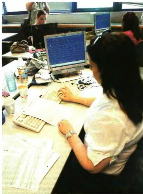
ΟΙ ΑΛΛΑΓΕΣ στα τεκμήρια ισχύουν για τα εισοδήματα του 2015

Χαμηλώνουν τα τεκμήρια για την κύρια κατοικία λόγω μείωσης των αντικειμενικών αξιών