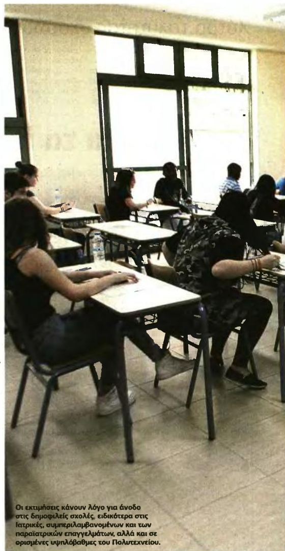
Οι εκτιμήσεις κάνουν λόγο για άνοδο στις δημοφιλείς σχολές, ειδικότερα στις Ιατρικές, συμπεριλαμβανομένων και των παραιτητικών επαγγελμάτων, αλλά και σε ορισμένες υψηλόβαθμες του Πολυτεχνείου.

Στις παραπάνω εκτιμήσεις θα πρέπει να σημειωθεί ότι με το νέο σύστημα μοριοδότησης κρίνονται μόνο οι γραπτοί βαθμοί στα πανελλαδικώς εξεταζόμενα μαθήματα και όχι ο βαθμός προαγωγής, όπως ίσχυε. Σύμφωνα με τους αναλυτές, αυτό θα «κοστίσει» 500-600 μόρια στους υποψηφίους στην τελική βαθμολογία, τα οποία βέβαια μπορεί να αντισταθμιστούν με υψηλούς βαθμούς στα τέσσερα εξεταζόμενα μαθήματα. ■