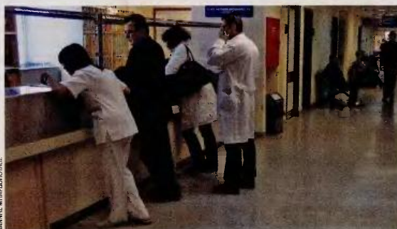
Στις παροχές περιλαμβάνεται μεταξύ άλλων και νοσοκομειακή περίθαλψη, σύμφωνα με κοινή υπουργική απόφαση.

Στις παροχές περιλαμβάνονται ιατρικές κλινικές εξετάσεις, διαγνωστικές εξετάσεις, νοσοκομει-