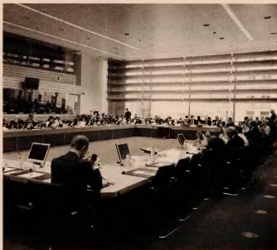
Οι θεσμοί έχουν ζητήσει όλες οι παρεμβάσεις να έχουν ψηφιστεί πριν από το Eurogroup της 22ας Απριλίου.

τον ΕΝΦΙΑ και κυρίως από τον φόρο που επιβάλλεται στις μεγάλες περιουσίες.