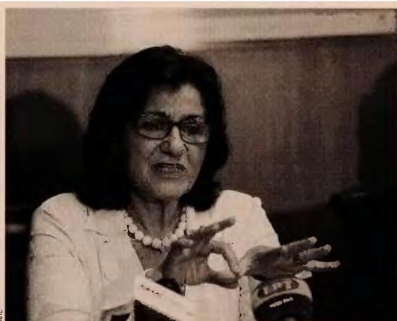
Η αναπληρώτρια υπουργός Κοινωνικής Αλληλεγγύης Θεανώ Φωτίου.

Παράλληλα, οι εκπρόσωποι των δανειστών ζητούν από την ηγεσία του υπουργείου Εργασίας, εντός του 2016, να διοχετευθούν