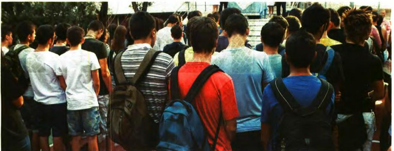
Η ΜΕΤΡΙΑ ΑΠΟΔΟΣΗ των Ελλήνων μαθητών αποδίδεται στον διαφορετικό προσανατολισμό του ελληνικού εκπαιδευτικού συστήματος σε σχέση με αυτά των χωρών που διακρίθηκαν

Μεταρρυθμίσεις στο εκπαιδευτικό σύστημα έχει προωθήσει και η κινεζική κυβέρνηση, που μεταξύ άλλων ενθαρρύνει την ενεργό συμμετοχή, τη διαδραστική και συνεργατική μάθηση αλλά και την εκπαίδευση και επαγγελματική ανάπτυξη των καθηγητών. Οι περιοχές που μετείχαν στο «PISA 2015» ανέλαβαν την πρωτοβουλία ώστε τα σχολεία να μην παρέχουν ενιαίο πρόγραμμα, αλλά να δίνουν την ευκαιρία μαθημάτων επιλογής στους μαθητές, ενώ στήριξαν το περιεχόμενο της διδασκαλίας στη μαθησιακή έρευνα, με στόχο την προώθηση της δημιουργικότητας και της κριτικής σκέψης. Επιπλέον, έχει δοθεί έμφαση στην ολοκληρωμένη αξιολόγηση.