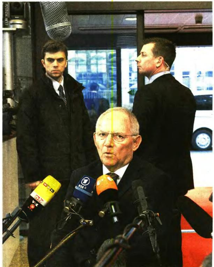
Στη συνεδρίαση του Eurogroup για την Ελλάδα... νίκησε ο Βόλφγκανγκ Σόιμπλε.

Αναφορικά με τα βραχυπρόθεσμα μέτρα ελάφρυνσης του χρέους, που αποφασίστηκαν τη Δευτέρα, αξιωματικούς της ευρωζώνης δήλωσε χθες ότι θα αρχίσουν να εφαρμόζονται άμεσα, ενώ εκτιμάται ότι θα μειώσουν το χρέος κατά 20 ποσοστιαίες μονάδες του ΑΕΠ μέχρι το 2060. Αυτό θα γίνει μέσω επιμύκνωσης της αποπληρωμής μέρους των δανείων από τα 28,3 στα 32,5 χρόνια, μέσω της μετατροπής κμινανόμενων επιτοκίων δανείων σε σταθερά και άλλων μικρότερων παρεμβάσεων διαχειριστικού χαρακτήρα. Το κόστος του μέτρου θα είναι μηδαμινό για τον Ευρωπαϊκό Μηχανισμό Σταθερότητας, δεδομένου ότι μπορεί