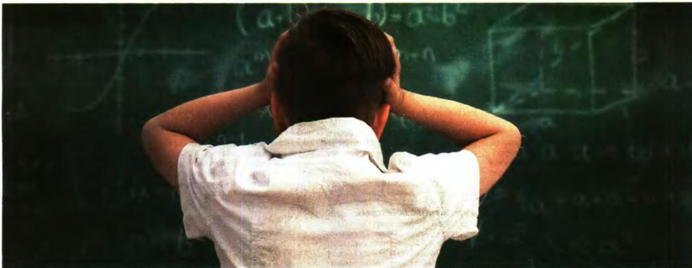
ΟΙ ΕΛΛΗΝΕΣ ΜΑΘΗΤΕΣ τα βρήκαν... σκούρα όχι μόνο στα μαθηματικά, αλλά και στις φυσικές επιστήμες και στην κατανόηση κειμένου

«Τα αποτελέσματα της έρευνας, αν και αποτυπώνουν μια ελαχίστη μόνο μεταβολή των επιδόσεων των Ελλήνων μαθητών, αξίζουν προσοχής», σχολίασε ο πρόεδρος του Ινστιτούτου Εκπαιδευτικής Πολιτικής, Γεράσιμος Κουζέλης, προσθέτοντας ότι τα ελληνικά αποτελέσματα χαρακτηρίζονται από «μεγάλη διαφορά ανάμεσα στις υψηλές επιδόσεις», γεγονός που θέτει εκ νέου το ζήτημα της εξίσωσης των όρων εκπαίδευσης και την ενίσχυση των πιο ευάλωτων ομάδων. Σύμφωνα με τον κ. Κουζέλη, θα πρέπει να υπάρξει πρόνοια κυρίως για την πραγματική και κριτική κατανόηση κειμένων, «ένα ζήτημα που σφραγίζει τις αδυναμίες του ελληνικού σχολείου». ●