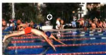
Το κολυμβητήριο βρίσκεται στην οδό Ιθάκης και Περικλέους στην Άνω Ηλιούπολη.

τμήματα εκμάθησης κολύμβησης ενηλίκων-ανηλίκων, aqua aerobics, κινητικής αποκατάστασης, ενώ μπορούν να το επισκεφθούν όλοι οι πολίτες πέντε ημέρες την εβδομάδα στις προκαθορισμένες ώρες