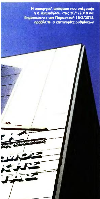
Η υπουργική απόφαση που υπέγραψε η κ. Αικατερίνη Αλεξιάδου, στις 26/1/2018 και δημοσιεύτηκε την Παρασκευή 16/2/2018, προβλέπει 8 κατηγορίες ρυθμίσεων.

4 Δανειολήπτες που έχουν λάβει «μικτό δάνειο» (από ίδια κεφάλαια του ΟΕΚ και τραπεζικά κεφάλαια) δύναται να ενταχθούν στις ρυθμίσεις μόνο κατά το μέρος του δανείου που προέρχεται από τα ίδια κεφάλαια του ΟΕΚ. Για την ένταξη στις ρυθμίσεις απαιτείται υποβολή αίτησης από το δανειολήπτη. Ως χρονικό όριο υποβολής της αίτησης ορίζεται διάστημα οκτώ μηνών από την ημερομηνία ανάρτησης στον ιστότοπο του ΟΑΕΔ της ηλεκτρονικής φόρμας της αίτησης ένταξης. ■