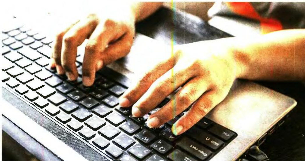
Οι υποψήφιοι που ανήκουν σε Ειδικές Κατηγορίες όπως, Πολύτεκνος, Παλινοσστήσις Πόντιος ομογενής κ.ά., πρέπει να δηλώσουν τα αντίστοιχα στοιχεία, κατά περίπτωση, στο πεδίο Ιδιότητες της ηλεκτρονικής αίτησης

Στην ηλεκτρονική αίτηση (ΠΕ, ΤΕ, ΔΕ, ΥΕ) τα αναλυτικά στοιχεία της εργασιακής εμπειρίας (εργοδοτής, αντικείμενο απασχόλησης, ασφαλιστικός φορέας) δεν μεταφέρονται από την καρτέλα του μπρώου, αλλά συμπληρώνονται