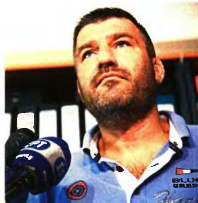
«Έχουμε ευθύνη απέναντι στον κόσμο να μην τον ταλαιπωρήσουμε άλλο», τόνισε ο πρόεδρος της ΠΟΕ-ΟΤΑ Νίκος Τράκας. Πέρα από συγγνώμη, είπε «ένα μεγάλο ευχαριστώ στην κοινωνία που μας στήριξε για 11 ημέρες».

Ούτως ή άλλως, η κατάσταση ήταν αισθητά βελτιωμένη τις τελευταίες