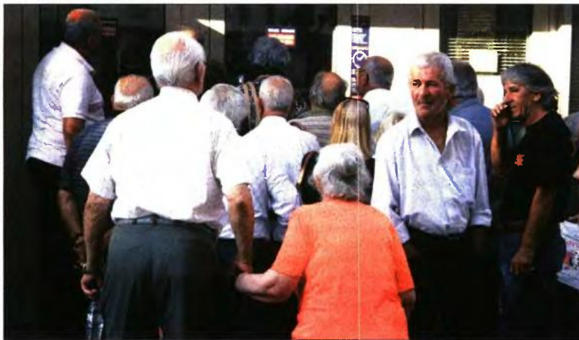
Συνταξιούχοι έξω από τράπεζα περμένουν να πάρουν τη σύνταξή τους. Κάτω: Το χθεσινό πρωτοσέλιδο της «δημοκρατίας»

Οι συνταξιούχοι προσπαθούν να πάρουν πίσω πάνω από 250.000.000 ευρώ, που έχασαν μέσα σε μια εξαετία από τις συντάξεις τους, καθώς τα ασφαλιστικά τους ταμεία παρακρατούσαν μεγαλύτερα ποσά από ό,τι έπρεπε. Οι συνταξιούχοι, ανάλογα με το ποσό της σύνταξης που εισπράτουν, έχασαν όλα αυτά τα χρόνια από 1.000 έως 3.000 ευρώ καθένας. Στο μεταξύ, απ' ό,τι φαίνεται, η εφαρμογή του νόμου σε ό,τι