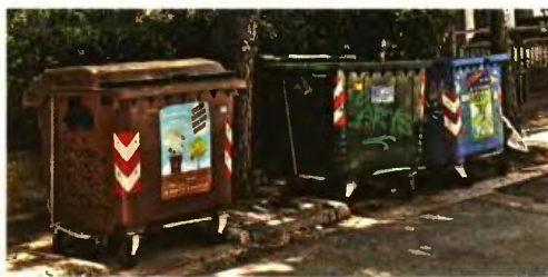
Εικόνα από δρόμο των Βριλησσιών, όταν άλλοι δήμοι πνίγονταν στα απορρίμματα