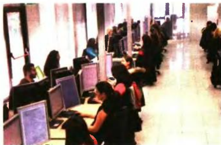
Σε 1.162,11 ευρώ ανέρχεται ο μέσος μισθός για πλήρη απασχόληση, σύμφωνα με τα στοιχεία του ΕΦΚΑ για τον Σεπτέμβριο 2016.

και το μέσο ημερομίσθιο έχουν υπολογιστεί για τις ασφαλιστέες ημέρες, ενώ στα οικοδομοτεχνικά έργα για τις πραγματοποιηθείσες ημέρες. Στις επιχειρήσεις με λιγότερους από δέκα μισθωτούς, το μέσο ημερομίσθιο πλήρους απασχόλησης ανέρχεται στο 63,29% του μέσου ημερομισθίου των ασφαλισμένων σε επιχειρήσεις με πάνω από δέκα μισθωτούς, ενώ ο μέσος μισθός