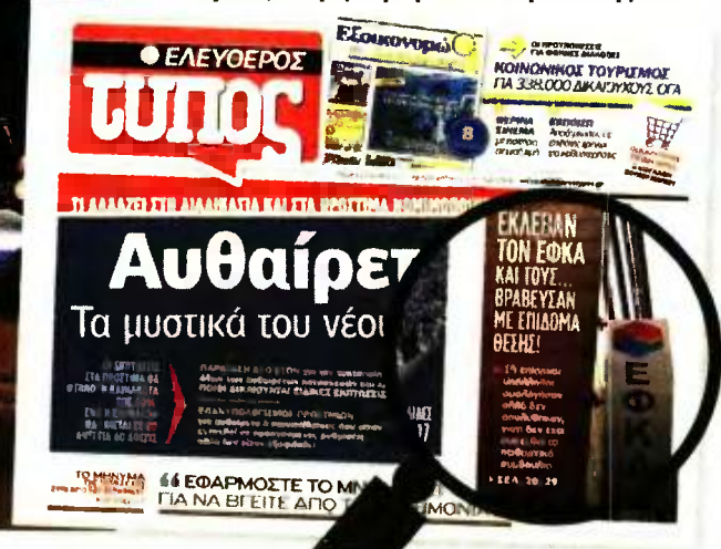
Το έγγραφο Μπακαλέξη που δείχνει ότι η διοίκηση του ΕΦΚΑ και η ηγεσία του υπ. Εργασίας γνώριζαν εδώ και 6 μήνες το πρόβλημα με το παιδαγωγικό συμβούλιο.