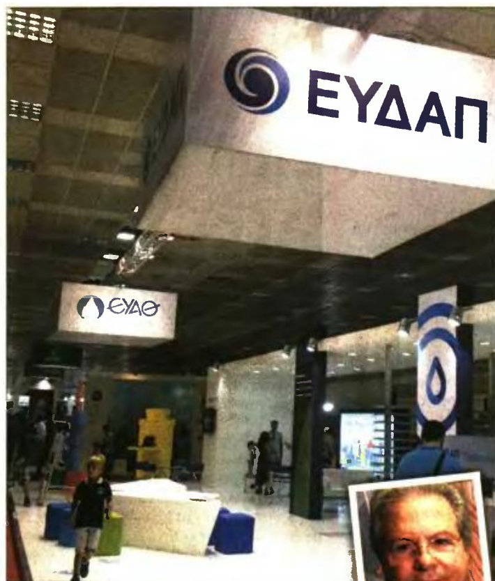
Η ΕΥΔΑΠ θα παρέχει δωρεάν ποσότητα νερού δύο κυβικά μέτρα ανά μήνα και ανά μέλος νοικοκυριού. Δεξιά: Ο διευθύνων σύμβουλος της ΕΥΔΑΠ, Ιωάννης Μπενίσης

Θα εφαρμοστεί, ακόμη, σε λογαριασμούς οι οποίοι θα εκδοθούν από 1/7/2017 και εφεξής και θα αφορούν καταναλώσεις που θα πραγματοποιηθούν από 1/5/2017 και μετά, και σε κάθε περίπτωση από την έκδοση του επόμενου λογαριασμού από την ημερομηνία