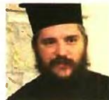
Ο Βασίλειος Σπηλιόπουλος

Αδιαφορώντας για την αγωνία των μαθητών που φέτος θα φοιτήσουν στην Α' Λυκείου, ο υπουργός Παιδείας ανακοίνωσε αυτή τη φορά ότι το σύστημα πρέπει να αλλάξει, αλλά όχι και να καταργηθούν οι εξετάσεις! Τα... γυμνάσια του κ. Γαβρόγλου στους μαθητές με τις Πανελλαδικές έγιναν την ημέρα κατά την οποία ανακοινώθηκαν οι βάσεις. «Πρέπει να αλλάξει το σημερινό σύστημα των πανελλαδικών εξετάσεων, όχι όμως και να καταργηθούν οι εξετάσεις για την εισαγωγή στην τριτοβάθμια εκπαίδευση» ήταν επί λέξει η απάντηση του υπουργού Παιδείας στην ερώτηση του δημοσιογράφου. Η τομεάρχης Παιδείας της ΝΔ Νίκη Κεραμέως δήλωσε: «Η δημαγωγία και η ανευθυνότητα της κυβέρνησης είναι απαράδεκτες και επικίνδυνες για την Παιδεία και το μέλλον των παιδιών μας». Στον αντίποδα αυτών των δηλώσεων, ο Κυριάκος Μητσοτάκης, αφού συνεχάρη σε μίνουμά του τους επιτυχόντες, ανέφερε μεταξύ άλλων: «Στόχος μας είναι μια Ελλάδα που δίνει ευκαιρίες σε όλους. Που δίνει δουλειές. Που δίνει σε όλους τη δυνατότητα να αναπτύξουν τις δεξιότητές τους, όπως κι αν είναι αυτές».