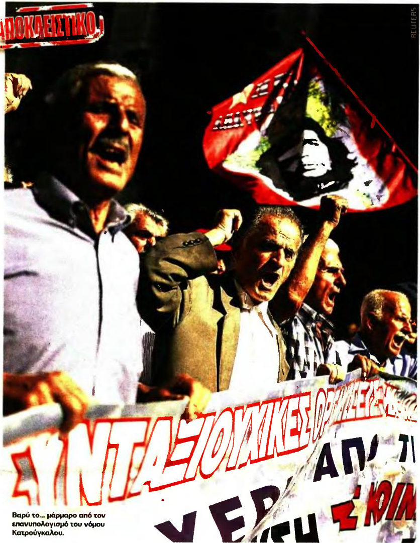
Βαρύ το... μάρμαρο από τον επανυπολογισμό του νόμου Κατρούγκαλου.

► Συνταξιούχος κατηγορίας ΠΕ με 35 έτη παίρνει σήμερα στην τσέπη 1.090 ευρώ (σύνταξη και επίδομα εξομάλυνσης). Με επίδομα παιδιού 50 ευρώ φτάνει στα 1.140 ευρώ. Με τον επανυπολογισμό και συντάξιμες αποδοχές 1.826 ευρώ, θα πάρει 1.001 ευρώ μικτά και 892 ευρώ καθαρά στην τσέπη από 1ης/1/2019.