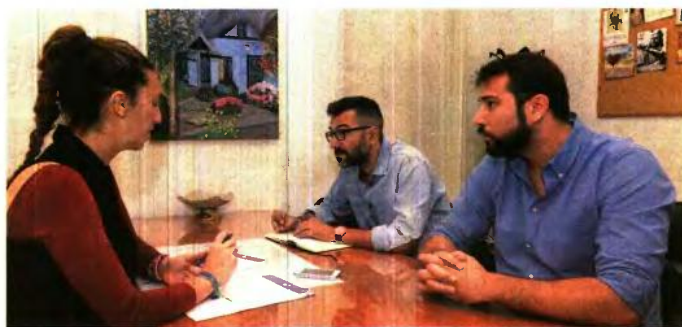
Η συνάντηση του «Ρ» συζήτησε με τον Β. Σίμο και τον Π. Κατηφέ

Το ΕΣΥΝ, στο πλαίσιο της πανελλαδικής του καμπάνιας με θέμα «Σκλήρα» και "μιασκά" ναρκωτικά: Μύθοι και αλήθειες», προ-