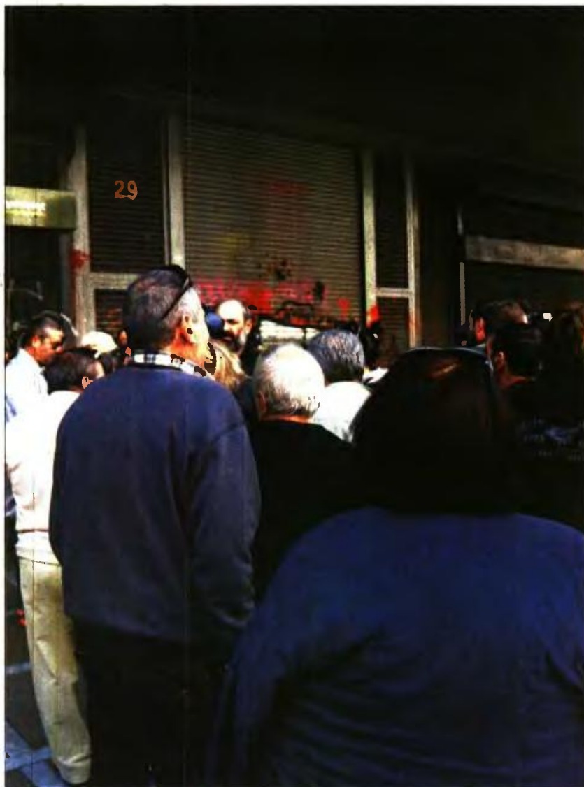
Από τη χθεσινή συγκέντρωση συνταξιούχων έξω από το υπ. Εργασίας

«Το Ασφαλιστικό έχει κλείσει στην πρώτη αξιολόγηση και δεν αποτελεί θέμα της δεύτερης» δήλωσε για το θέμα αυτό ο κ. Κατρούγκαλος, τονίζοντας ότι «αυτό που εξετάζεται από τους θεσμούς είναι αποκλειστικά και μόνο η εφαρμογή του νόμου 4387/2016, δηλαδή η έκδοση των αναγκαίων εγκυκλίων και υπουργικών αποφάσεων».