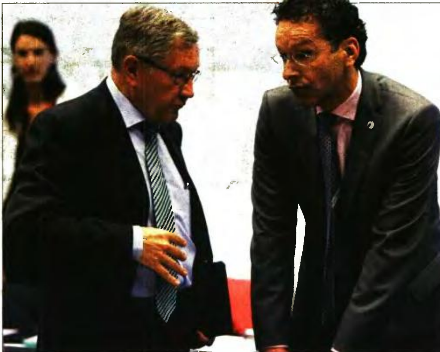
Ο επικεφαλής του ESM Κλάους Ρέγκλινγκ και ο πρόεδρος του Eurogroup Γερόν Ντάισελμπλουμ

ΜΟΝΟ βραχυπρόθεσμα μέτρα-ψίκουλα προτίθενται να λάβουν έως το τέλος του έτους οι Ευρωπαίοι για την ελάφρυνση του ελληνικού χρέους, όπως ξεκαθάρισαν ο πρόεδρος του Eurogroup Γερόν Ντάισελμπλουμ και ο επικεφαλής του Ευρωπαϊκού Μηχανισμού Σταθερότητας (ESM) Κλάους Ρέγκλινγκ.