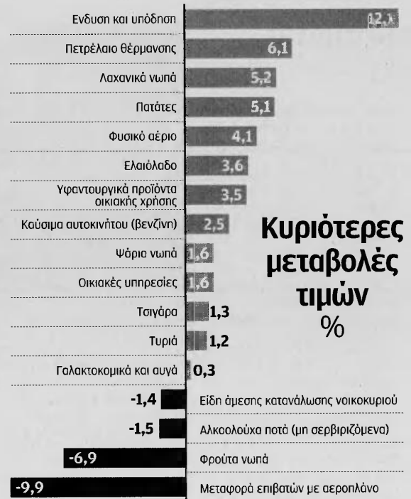
ΝΟΕΜΒΡΙΟΣ - ΔΕΚΕΜΒΡΙΟΣ 2016

Αξίζει να σημειωθεί πως το οικονομικό επιτελείο αναμένει ότι φέτος θα είναι η πρώτη χρονιά που δεν θα καταγραφεί αποπληθωρισμός, έπειτα από 3 συναπτά έτη μείωσης του επίσημου γενικού δείκτη τιμών καταναλωτή.