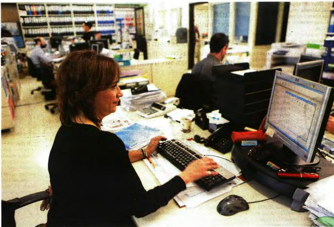
Στην πρέσα των νέων ορίων ηλικίας και των ανατροπών στα «μπλοκάκια» θα βρεθούν οι νέοι ασφαλισμένοι

1 Καταργήθηκε από την 1η Ιανουαρίου 2017 η ευνοϊκή ρύθμιση, που προέβλεπε πως οι νέοι ασφα-