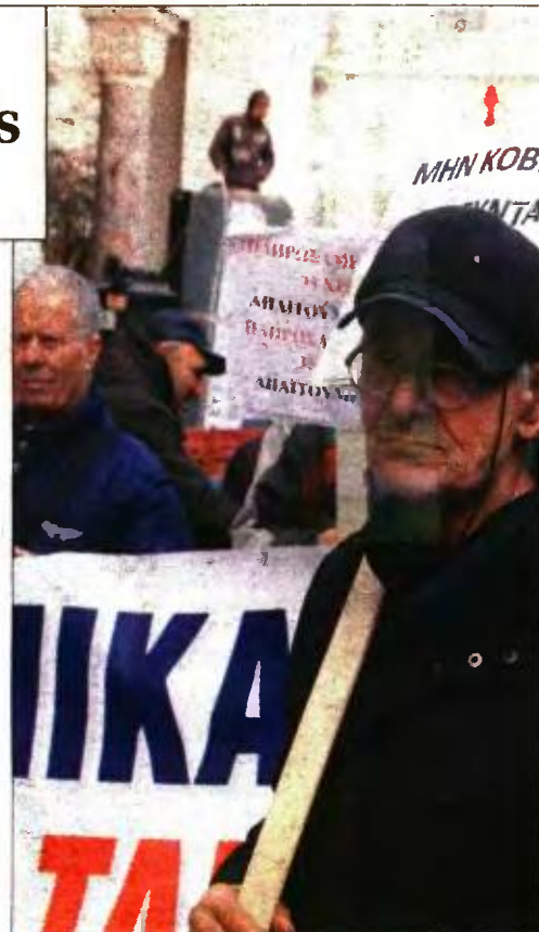
Συνταξιούχοι σε διαδήλωση κατά των περικοπιών στις αποδοχές τους

Οστόσο, δεν γίνεται καμία νύξη για τις 129.531 εκκρεμείς επικουρικές συντάξεις που οφείλει στους ασφαλισμένους και των οποίων