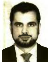
Γράφει ο Διονύσης Ρίζος

σοβαρές οικονομικές επιβαρύνσεις πλέον είναι πιθανό το ενδεχόμενο να ωφελεί περισσότερο η μειωμένη σύνταξη. Ετσι για παράδειγμα μισθωτός ασφαλισμένος 62 ετών που έχει συμπληρώσει 35 έτη ασφάλισης, για