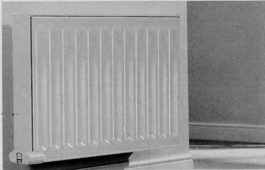
Η χρήση του φυσικού αερίου για θέρμανση προσφέρει εξοικονόμηση που ξεπερνά το 35% συγκριτικά με το πετρέλαιο (Δεκέμβριος 2016), ενώ για το ζεστό νερό η εξοικονόμηση υπερβαίνει το 70% συγκριτικά με το ηλεκτρικό ρεύμα.

Ασαφές παραμένει το πλαίσιο για την αυτονομία στη θέρμανση με φυσικό αέριο, 20 ημέρες μετά την ψήφιση της τροπολογίας που καταργεί την υποχρέωση της συναίνεσης του «50 συν 1» των ενοίκων στις πολυκατοικίες. Κύκλοι του υπουργείου Ενέργειας αναγνώριζαν χθες ότι πρέπει να υπάρξει ρύθμιση σε σχέση με τις υποχρεώσεις που απορρέουν για όσους αυτονομηθούν στο κόστος συντήρησης της κεντρικής θέρμανσης. Τόνιζαν ότι θα υπάρξει διευκρινιστική εγκύκλιος για την εφαρμογή της τροπολογίας, ενώ παράλληλα διαβεβαίωναν ότι ανεξάρτητα από την έκδοσή της οι ενδιαφερόμενοι μπορούν ήδη να απευθυνθούν στην ΕΠΑ Αττικής για σύνδεση στο δίκτυο φυσικού αερίου χωρίς να απαιτείται απόφαση γενικής συνέλευσης για την αυτονόμησή τους από την κεντρική θέρμανση. Οι ίδιοι κύκλοι διαβεβαίωναν επίσης ότι η εγκύκλιος δεν θα υποχρεώνει όσους αυτονομηθούν να πληρώνουν πάγιο, το οποίο συνδέεται με την κατανάλωση πετρελαίου στην κεντρική θέρμανση, αλλά να συνεισφέρουν για τη συντήρηση της κεντρικής θέρμανσης. Μέχρι να εκδοθεί η σχετική εγκύκλιος, το όλο θέμα παραμένει ασαφές και καθιστά