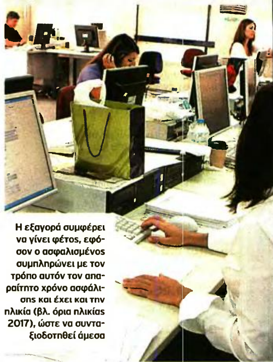
Η εξαγορά συμφέρει να γίνει φέτος, εφόσον ο ασφαλισμένος συμπληρώνει με τον τρόπο αυτόν τον απαραίτητο χρόνο ασφάλισης και έχει και την ηλικία (βλ. όρια ηλικίας 2017), ώστε να συνταξιοδοτηθεί άμεσα

▶ Η εξαγορά είναι ακριβότερη για τους ασφαλισμένους του ιδιωτικού τομέα με υψηλές αποδοχές