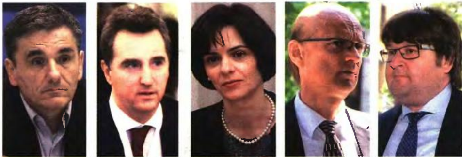
Ο υπουργός Οικονομικών Ευκλείδης Τσακαλώτος, ύστερα από τον 10ωρο προχθεσινό γύρο διαβουλεύσεων προσηγγίγεται ότι η χθεσινή ημέρα (και νύχτα) θα ήταν η τελευταία των διαπραγματεύσεων με το κουαρτέτο.

Υστερα από τις πολύωρες συζητήσεις του Σαββάτου, η κυβέρνηση ήρθε αντιμέτωπη με την επιμονή του κουαρτέτου για σκληρά μέτρα σε όλα τα μέτωπα: ασφαλιστικό, «κόκκινα» δάνεια, φορολογικό. Είσι, η χθεσινή ημέρα κύλησε με την ελληνική κυβέρνηση -ύστερα από πολύωρες συσκέψεις- να καταθέτει καινούργιες προτάσεις, σε μια προσπάθεια να γεφυρωθούν οι διαφορές, έστω και μεταμοσύνοντάς. Η... πίσω από χρόνον που ζητήσαν οι επικεφαλής του κουαρτέτου προκειμένου να μελετήσουν τις ανανεωμένες προτάσεις είχε ως αποτέλεσμα ο τελικός γύρος των διαβουλεύσεων να αναβληθεί τρεις φορές: από τις τέσσερις μετατέθηκε για τις πέντε το απόγευμα, στη συνέχεια για τις οκτώ το βράδυ με αποτέλεσμα να ξεκινήσει τελικός αργά χθες το βράδυ με προοπτική να ολοκληρωθεί τις πρώτες πρωινές ώρες. Και οι δύο πλευρές μπήκαν χθες στην αίθουσα των διαπραγματεύσεων με στόχο να συμφωνήσουν επί των τελικών αλλαγών που θα γίνονταν στα δύο μνημονιακά κείμενα: το πρώτο είναι αυτό που θα υπογρα-