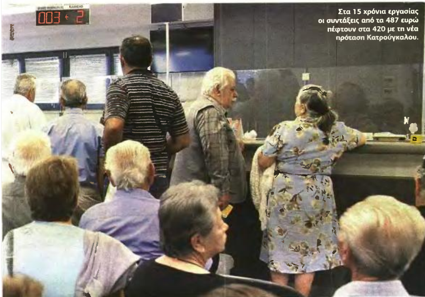
Στα 15 χρόνια εργασίας οι συντάξεις από τα 487 ευρώ πέφτουν στα 420 με τη νέα πρόταση Κατρούγκαλου.

ευρώ μείωση 15%, στα 200 ευρώ μείωση 20% και πάνω από τα 400 ευρώ επικουρικής μειώσεις 35% ως 40%.