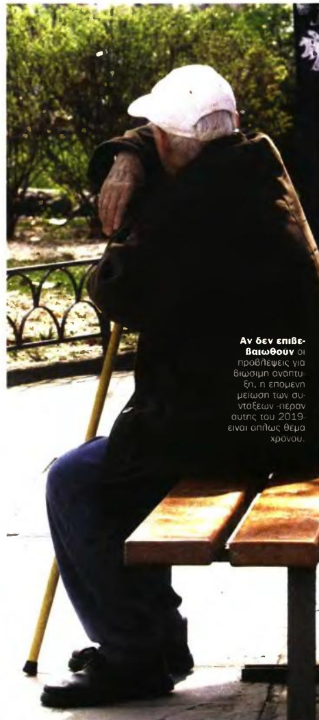
Αν δεν επιβεβαιωθούν οι προβλέψεις για βιώσιμη ανάπτυξη, η επόμενη μείωση των συντάξεων -πέραν αυτής του 2019- είναι απλώς θέμα χρόνου.