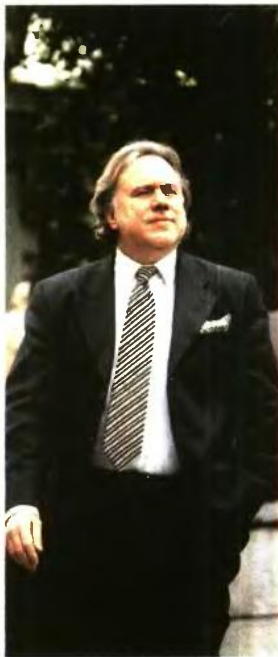
ΤΟΡΑ ξεδιπλώνονται οι αιθέρες, εφιαλτικές πιέξεις του νόμου Κατρούγκαλου

Η νέα και πολλαπλή «σφαγή» των συντάξεων είναι λοιπόν γεγονός. Ο τρομος του ΑΤΜ ή του τραπεζικού γκιόσέ και λαμβάνει εκ νέου τους συνταξιούχους, καθώς μίνα με το μήνα συνειδητοποιούν ότι το μιστήριο των περικοπών και ο καταפורος της κυβερνητικής κοροϊδίας, δυστυχώς δεν έχουν τέλος. Πράγματι, όσο ξεδιπλώνονται οι πραγματικές και κυρίως αιθέριες πιέξεις του νόμου Κατρούγκαλου οι συνταξιούχοι κάθε προέλευσης, παλίοι και νέοι, γενικής κατάταξης ή ειδικών κατηγοριών, ανεξαρτήτως ηλικίας, ταμείου και οικογενειακής καταστάσεως περνούν από ένα ακόμη χειρουργικό τραπέζι των αποδοχών τους, δικαιωθάνομενοι μάλιστα ότι δεν θα είναι το τελευταίο.