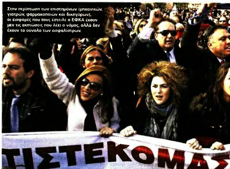
Στην περίπτωση των επιστημόνων (μηχανικών, γιατρών, φαρμακοποιών και δικηγόρων), οι εισφορές που τους έστειλε ο ΕΦΚΑ έχουν μεν τις εκπτώσεις που λέει ο νόμος, αλλά δεν έχουν το συνολο των ασφαλιστών.

Επίσης στις ατομικές επιχειρήσεις ενώ πέρυσι ο φόρος υπολογιζόταν με ανώτατο συντελεστή 33%, φέτος θα υπολογιστεί