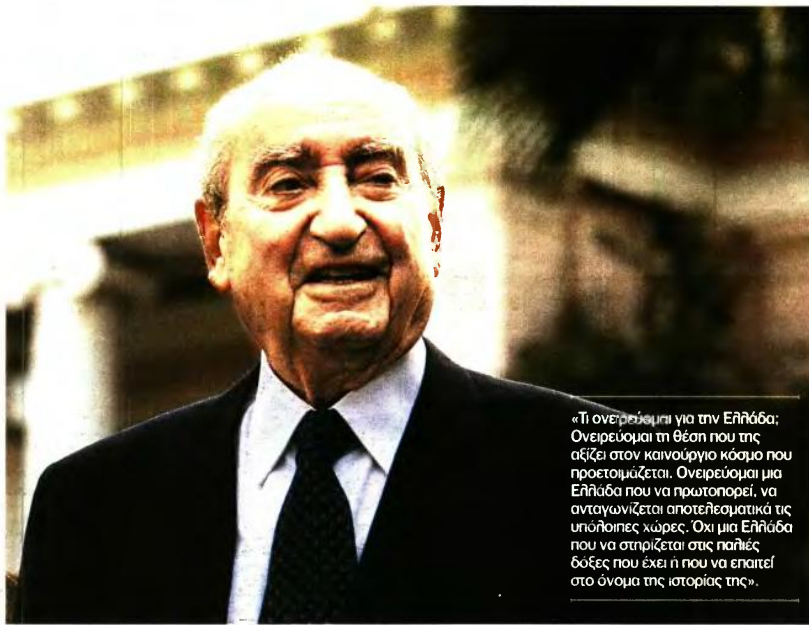
«Τι ονειρεύομαι για την Ελλάδα; Ονειρεύομαι τη θέση που της αξίζει στον καινούργιο κόσμο που προετοιμάζεται. Ονειρεύομαι μια Ελλάδα που να πρωτοπορεί, να ανταγωνίζεται αποτελεσματικά τις υπόλοιπες χώρες. Όχι μια Ελλάδα που να στηρίζεται στις παλιές δόξες που έχει ή που να εμπατεί στο όνομα της ιστορίας της».

Τα ξημερώματα της Δευτέρας, έχοντας στο πλάι του τα πρόσωπα που αγαπούσε και τον αγαπούσαν, όπως ανέφερε η λιτή ανακοίνωση της οικογένειας, έφυγε από τη ζωή ο πρώην πρωθυπουργός και επίτιμος πρόεδρος της Νέας Δημοκρατίας, Κωνσταντίνος Μητσοτάκης . Βουλευτής, υπουργός, πρόεδρος, πρωθυπουργός, γιος, σύζυγος, πατέρας, παππούς. Με την παρουσία του στην ελληνική πολιτική σκανή από το 1946, οπότε εξελέγη για πρώτη φορά βουλευτής και στα 28 του χρόνια έγινε ο πιο νέος εκπρόσωπος του