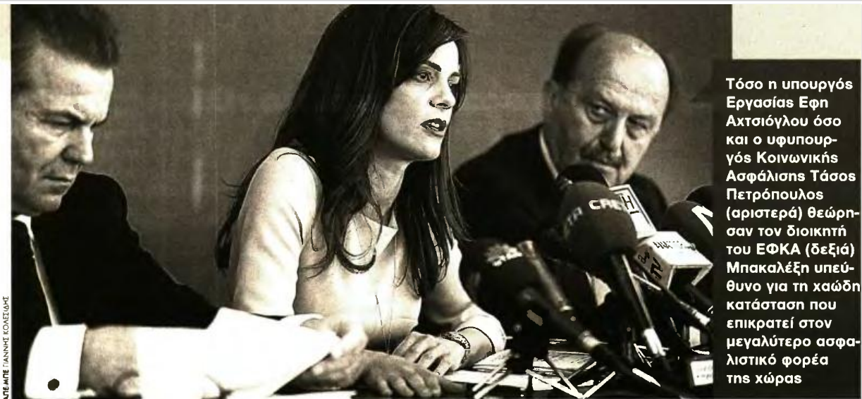
Τόσο η υπουργός Εργασίας Εφη Αχτσιόγλου όσο και ο υφυπουργός Κοινωνικής Ασφάλισης Τάσος Πετρόπουλος (αριστερά) θεώρησαν τον διοικητή του ΕΦΚΑ (δεξιά) Μπακαλέξη υπεύθυνο για τη καώδη κατάσταση που επικρατεί στον μεγαλύτερο ασφαλιστικό φορέα της χώρας