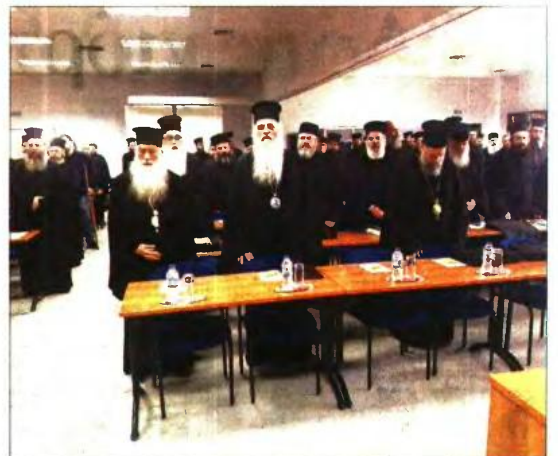
Στην ενημερωτική ημερίδα συμμετείχαν 75 εκπρόσωποι από 50 Μητροπόλεις. Κεντρικός ομιλητής ήταν Μητροπολίτης Μεσογαίας και Λαυρεωτικής κ. Νικόλαος, πρόεδρος της Επιτροπής Βιοηθικής της Ιεράς Συνόδου

Καταλήγοντας, αναφέρθηκε στην ασάφεια των παραγόντων που συντελούν στη διαμόρφωση του φαινομένου της ομοφυλοφιλίας, καθώς, όπως σημείωσε, «δεν υπάρχουν ακόμα ξεκάθαρες επιστημονικές αποδείξεις όσον αφορά τα αίτια του φαινομένου, ενώ είναι πιθανόν πολλά από τα επιστημονικά πορί-