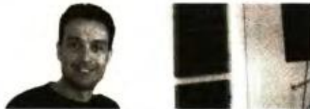
Του Γιώργου Λαμπράκη