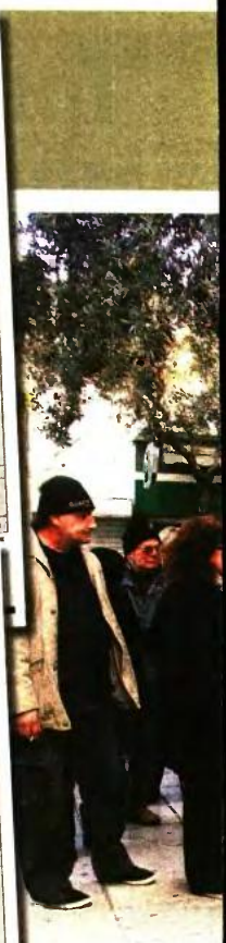
1. Στο πρώτο ενημερωτικό 119,96 ευρώ (ν. 4093/2012). 2. Στο δεύτερο ενημερωτικό κάπου 70 ευρώ. Έχασε 1 συνολική περίκοπή 292,5 ασθένειας που παρακρατά χρήματα θα πρέπει να κούρεψαν τους επιστροφών τους.

▶▶ ΣΥΝΤΑΞΙΟΥΧΟΣ ΕΠΡΕΠΕ ΝΑ ΠΑΡΕΙ 228 €, ΑΛΛΑ ΔΕΝ ΠΗΡΕ Ο