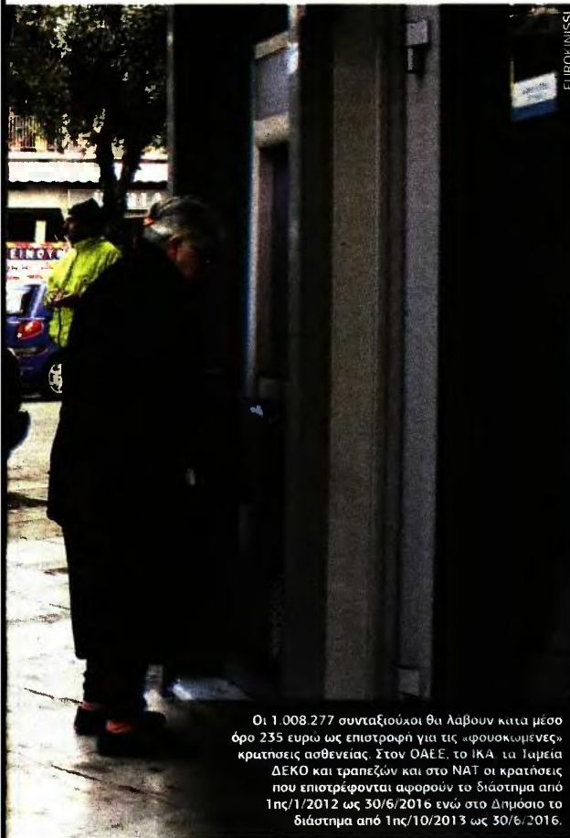
Οι 1.008.277 συνταξιούχοι θα λάβουν κατά μέσο όρο 235 ευρώ ως επιστροφή για τις «φρουκωμένες» κρατήσεις ασθενείας. Στον ΟΑΕΕ, το ΙΚΑ, τα Ταμεία ΔΕΚΟ και τραπεζών και στο ΝΑΤ οι κρατήσεις που επιστρέφονται αφορούν το διάστημα από 1ης/1/2012 ως 30/6/2016 ενώ στο Δημόσιο το διάστημα από 1ης/10/2013 ως 30/6/2016.

συνταξιούχων εξαρτάται όχι από τη σύνταξη που παίρνουν σήμερα, αλλά από το ποσό που είχαν είτε από σύνταξη (κύρια) είτε από άθροισμα συντάξεων (κύρια, επικουρική ή και μέρισμα) πριν από τις μειώσεις του Μνημονίου.