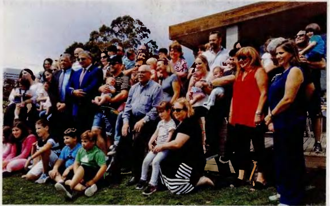
Παιδιά που γεννήθηκαν με εξωσωματική γονιμοποίηση με τους γονείς τους.

Γιατί, όμως, να αναγκαστεί ένα υπογονιμο ζευγάρι να κάνει ένα τόσο μεγάλο ταξίδι; «Η Ελλάδα σημειώνει εξαιρετικά υψηλές επιδόσεις στην εξωσωματική γονιμοποίηση, μια διαδικασία που κοστίζει πολύ λιγότερο απ' ό,τι στις περισσότερες χώρες του εξωτερικού», σημειώνει ο δρ Πάντος, αντιπρόεδρος του Παγκόσμιου Ινστιτούτου Ελλήνων γιατρών: «Στην Αυστραλία το κόστος κυμαίνεται από 10.000-15.000 δολάρια». Ωστόσο, δυνατό «χαρτί» για την επιλογή της Ελλάδας είναι η νομοθεσία, που επιτρέπει τη λήψη ωαρίων και σπέρματος από ανώνυμους δότες. «Συνεργαζόμαστε και με τη Νότιο Αφρική αλλά και τις ΗΠΑ», διευκρινίζει