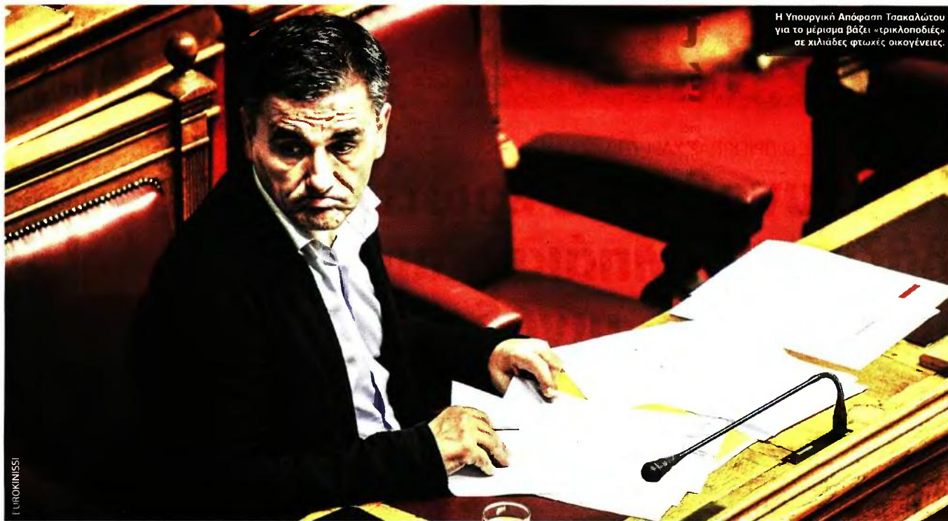
Η Υπουργική Απόφαση Τσακαλώτου για το μέρισμα βάζει «τρικλοποδιές» σε χιλιάδες φτωχές οικογένειες.

ΦΤΩΧΑ ΝΟΙΚΟΚΥΡΙΑ ΧΑΝΟΥΝ ΤΟ ΒΟΗΘΗΜΑ Ή ΤΟ ΛΑΜΒΑΝΟΥΝ ΜΕΙΩΜΕΝΟ ΚΑΤΑ 22,2% Ή 44,4%