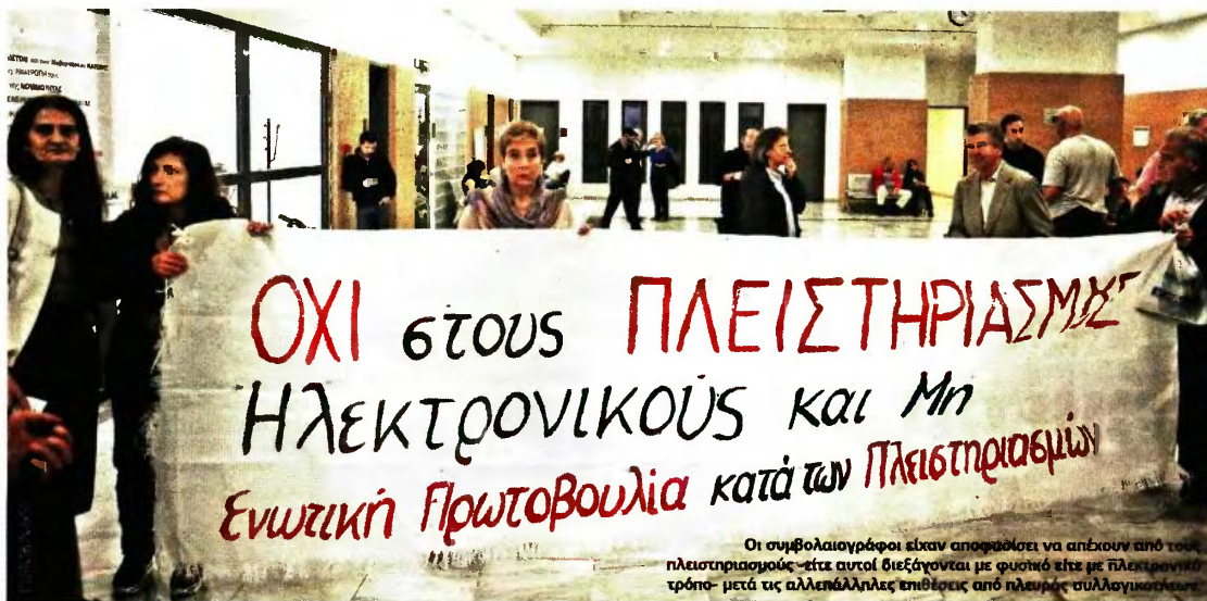
Οι συμβολαιογράφοι είναι αποφασισμένοι να απέχουν από τους πλειστηριασμούς -έτσι αυτοί διεξάγονται με φυσικό είτε με ηλεκτρονικό τρόπο- μετά τις αλληλέγγυες επιθέσεις από πλευράς συλλογικοτήτων