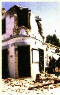
Απαλλοτρίωση από τον ΕΝΦΙΑ όλων των κτισμάτων που υπέστησαν ζημιές από το σεισμό στην Κω, για τα επόμενα δύο χρόνια.

Οι ιδιοκτήτες ακινήτων στα μεγάλα αστικά κέντρα προφανώς δεν είναι ψηφοφόροι του ΣΥΡΙΖΑ. Οχι για. Αυτοί θα κληθούν να πληρώσουν το μεγαλύτερο μέρος του – κατά τα άλλα ενιαίο – φόρου ιδιοκτησίας ακινήτων. Υπάρχουν περιοχές όπου τα εκκαθαριστικά ΕΝΦΙΑ προκαλούν κυριολεκτικά «εγκεφαλικό». Παραδείγματα: