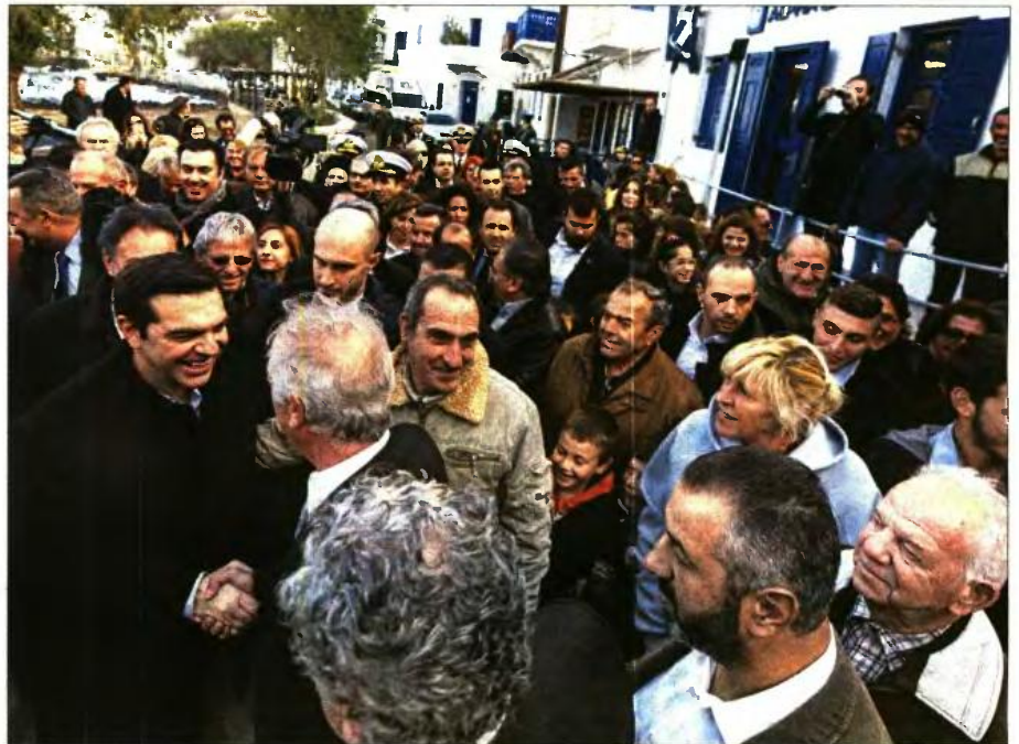
Ο Αλέξης Τσίπρας χαιρετά κατοίκους της Νίσυρου

«Ακούω τώρα τελευταία διάφορους τεχνοκράτες, ανόπλιτους θα έλεγα - τους έχουμε, υποτίθεται, για να μας λένε σωστά τους αριθμούς, ούτε αυτούς δεν μας λένε σωστά. Έχουν παραδεχτεί αρκετές φορές ότι έχουν κάνει λάθος στους αριθμούς, αλλά μας λένε τώρα ξανά ότι το λάθος είναι το σωστό» είπε και συνέχισε: «Και μας λέγαμε από το 2010 ότι με αυτό το πρόγραμμα θα βγούμε από την κρίση. Απέτυχε αυτό και το επόμενο, του 2012, έκαναν υπεραισιόδοξες προβλέψεις επιβάλλοντας μέτρα σκληρής λιτότητας, και τώρα που έχουμε ένα πρόγραμμα με ήπια προσαρμογή κάνουν προβλέψεις ύφεσης, ενώ έχουμε γυρίσει στην ανάπτυξη, και προβλέψεις ελλείμματος για το 2015 και 2016, ενώ έχουμε ξεπεράσει τις προβλέψεις και έχουμε υπεραπόδοση στόχων. Θέλω, λοιπόν, να απαντήσω σε όλους αυτούς ότι η Ελλάδα βεβαίως και είναι μια χώρα της Ε.Ε., βεβαίως και θα φροντίσει να τηρήσει όλες τις δεσμεύσεις που απορρέουν από αυτό, αλλά δεν πρόκειται να υποστεί τη σημαία της υποστήριξης της κοινωνικής της συνοχής». Και κατέληξε: «Θα τηρήσουμε το πρόγραμμα μέχρι κεραίας, αλλά οποιαδήποτε υπέρβαση σε στόχους και έσοδα υπάρχει μέσα από την τήρηση του προγράμματος, δεν θα ρωτήσουμε κανέναν για να δώσουμε αυτά τα χρήματα σε αυτούς που τα έχουν ανάγκη περισσότερο».