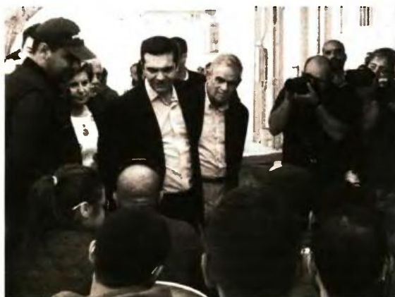
Αν θέλουν να διαθέτουν χρήματα στους λαθρομετανάστες ας το κάνουν με την κρατική επιχορήγηση που λαμβάνουν τα κόμματά τους.

Ένα περίπου μήνα πριν, η Βουλή υπερψήφισε τον προϋπολογισμό της για το 2017, προϋπολογισμό τον οποίο φυσικά καταψήφισε η Χρυσή Αυγή ως επιτομή της υποκρισίας. Κατά τη διάρκεια της συζήτησής του, Σύριζα, ΝΔ και λοιπές «δημοκρατι-