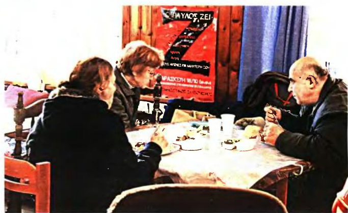
Σε όλους τους χώρους του κοινωνικού στεκιού στο Πέραμα ένα είναι το μήνυμα: καμία ανοχή στον φασισμό