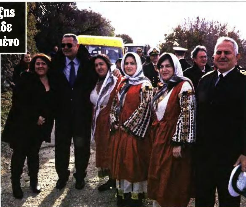
Ο Πάνος Καμμένος με γυναίκες ντυμένες με παραδοσιακές φορεσιές χθες στη Νίσυρο

«Ήταν στο πανηγύρι της Παναγίας, που μοίραζαν κρέας και πατάτες βραστές, και τότε ήταν και ο Πάνος Καμμένος ως πολιτευτής της Δεξιάς. Εγώ από μικρός στον χώρο της Αριστεράς, όταν τον είδα, τον πέρασα για μπούλη. Οτι ήταν ένα παιδί πλούσιου οικογένειας» είπε ο κ. Τσίπρας, για να διευκρινίσει αμέσως μετά, ενώ το ακροατήριο είχε ξεσπάσει σε γέλια: «Ο Πάνος όμως είναι ένας καθαρά λαϊκός άνθρωπος, ζεστός, που έπιανε κουβέντα με όλους, ένας εξαιρετικά οικείος πολιτικός. Και το σχολίασα στη γυναικία μου, με την οποία από τότε είμαστε μαζί. Είναι ένας άνθρωπος έξω καρδιά, με τον οποίο έχουμε μια εξαιρετική συνεργασία. Και να χαιρέσετε που είναι από εδώ».