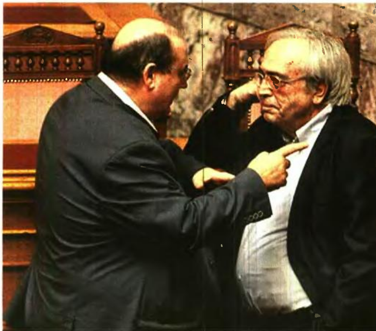
Το νομοσχέδιο για την ιδιωτική εκπαίδευση που είχε επιχειρήσει να περάσει ο πρώην υπουργός Παιδείας Αριστέιδης Μπαλτάς (δεξιά) τον Ιούνιο του 2015 αλλά δεν πρόλαβε λόγω εκλογών επιχειρεί να περάσει ο Νίκος Φίλης

■ Καθίσταται πολύ δύσκολο να απολυθεί ιδιωτικός εκπαιδευτικός ύστερα από έξι χρόνια υπηρεσίας, ενώ τη νομιμότητα απολύσεων κρίνει τριμελές συμβούλιο από εκπροσώπους ιδιοκτητών, εκπαιδευτικών και πολιτείας.