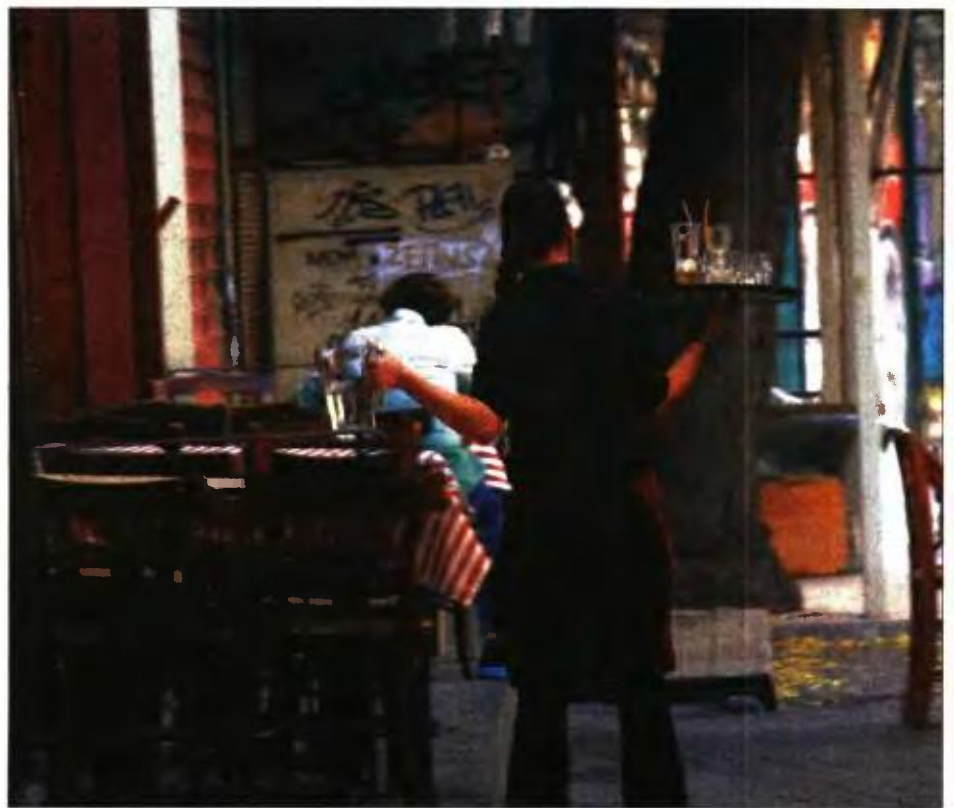
Κάθε χρόνο αυξάνεται ο αριθμός των εργαζομένων με συμβάσεις μερικής απασχόλησης

Ειδικότερα, από τα στοιχεία που δημοσίευσε ο ΕΦΚΑ προκύπτει ότι υποβλήθηκαν και έγιναν αντικείμενο επεξεργασίας Αναλυτικές Περιοδικές Δηλώσεις (ΑΠΔ) από 235.129 κοινές επιχειρήσεις και 12.083 από οικοδομοτεχνικά έργα. Ο αριθμός των ασφαλισμένων που έχουν δηλωθεί στις ΑΠΔ ανέρχεται σε