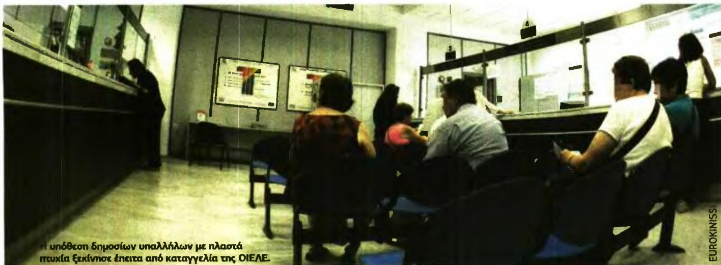
Η υπόθεση δημοσίων υπαλλήλων με πλαστά πτυχία ξεκίνησε έπειτα από καταγγελία της ΟΙΕΛΕ.