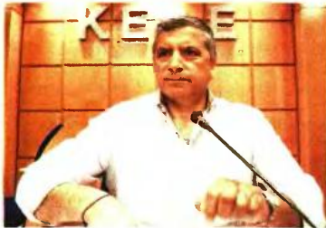
Ο πρόεδρος της ΚΕΔΕ, Γ. Πατούλης.

ΕΚΚΛΗΣΗ προς τους δημάρχους ώστε να μην εξαντλούν την αυστηρότητα του νόμου για πλειστηριασμούς πρώτης κατοικίας σε περιπτώσεις μικρών οφειλών από ευπαθείς ομάδες και κατόχους πρώτης κατοικίας απευθύνει με επιστολή του ο πρόεδρος της Κεντρικής Ένωσης Δήμων (ΚΕΔΕ) Γ. Πατούλης.