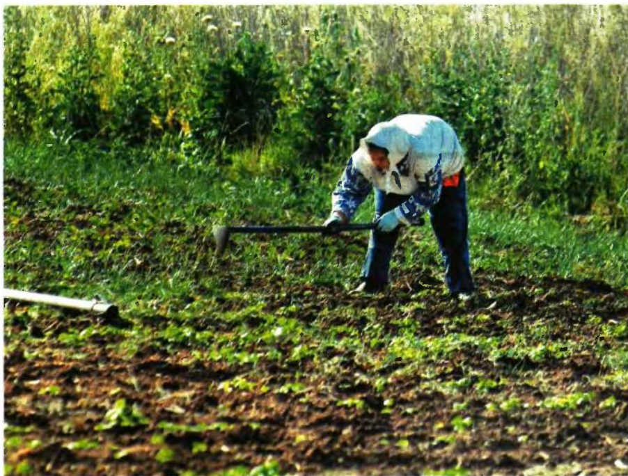
«Κλειδί» για αυξημένη σύνταξη είναι η ένταξη στον κλάδο Πρόσθετης Ασφάλισης, που λειτουργούσε τη 10ετία 1988-1997