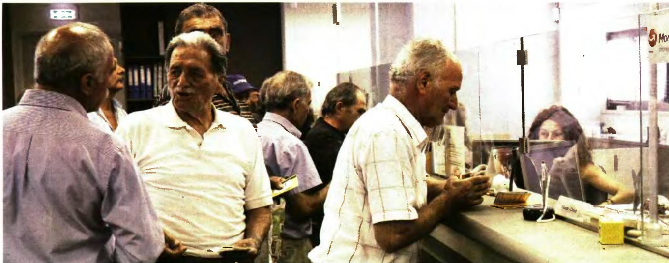
ΜΕ ΤΙΣ ΠΛΗΡΩΜΕΣ του Νοεμβρίου θα δουν οι συνταξιούχοι τις πρώτες παρακρατήσεις που προκύπτουν στις συντάξεις τους