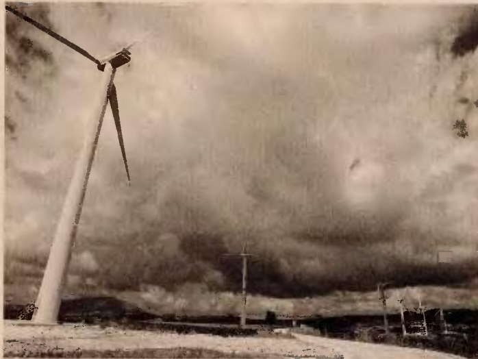
Το υπουργείο μετέθεσε τις αυξήσεις του τέλους «πράσινης» ενέργειας ΕΤΜΕΑΡ και των τιμολογίων ρεύματος για το 2017.

Το σκεπτικό του νόμου ήταν ότι οι προμηθευτές ρεύματος επωφελούνται από τις χαμηλές τιμές της Οριακής Τιμής του Συστήματος που διαμορφώνει η συμμετοχή των ΑΠΕ στη χονδρική αγορά και γι' αυτό πρέπει να αναλάβουν μέρος του ελλείμματος που δημιουργείται από τις αποκλίσεις με τις εγγυημένες τιμές. Στη βάση αυτή, ενώ ο σχε-