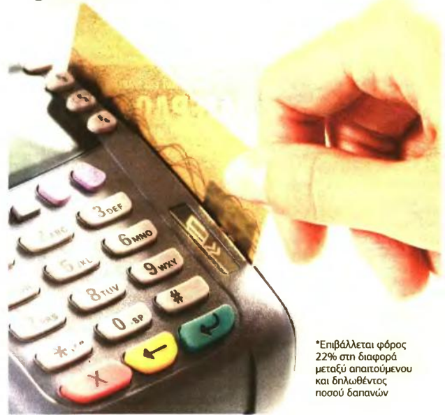
*Επιβάλλεται φόρος 22% στη διαφορά μεταξύ απαιτούμενου και δηλωθέντος ποσού δαπανών

* ΠΟΣΟΣΤΟ ΕΛΑΧΙΣΤΗΣ ΔΑΠΑΝΗΣ ΜΕ ΗΛΕΚΤΡΟΝΙΚΗ ΣΥΝΑΛΛΑΓΗ € ΕΙΣΟΔΗΜΑ ΣΕ ΕΥΡΩ