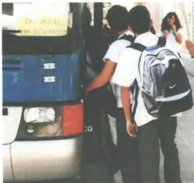
Εκτός μαθητικών δρομολογίων μένουν και φέτος πολλά παιδιά εξαιτίας των προϋποθέσεων που θέτει η Κοινή Υπουργική Απόφαση που ισχύει και για αυτή τη σχολική χρονιά.

Τα πάνω κάτω στα μαθητικά δρομολόγια στην Κεντρική Μακεδονία έφερε και τη φετινή σχολική χρονιά η Κοινή Υπουργική Απόφαση (ΚΥΑ), η οποία προβλέπει μεταξύ άλλων τη μεταφορά των παιδιών στο σχολείο υπό προϋποθέσεις, που αφορούν τις χιλιομετρικές αποστάσεις, και τη μετάβαση με τα πόδια, όταν υπάρχει ενδεδειγμένη πεζή διαδρομή.