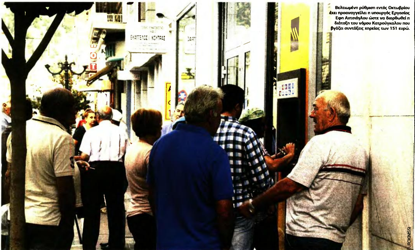
Βελτιωμένη ρύθμιση εντός Οκτωβρίου έχει προαναγγείλει η υπουργός Εργασίας Εφη Ακτσιόγλου ώστε να διορθωθεί η διάταξη του νόμου Κατρούγκαλου που βγάζει συντάξεις χρείας των 151 ευρώ.

ΥΠΟ ΤΟ ΦΟΒΟ ΤΗΣ ΚΟΙΝΩΝΙΚΗΣ ΚΑΤΑΚΡΑΥΓΗΣ, Η ΚΥΒΕΡΝΗΣΗ ΕΠΙΧΕΙΡΕΙ ΝΑ... ΦΡΕΝΑΡΕΙ ΤΙΣ ΜΕΙΩΣΕΙΣ, ΒΑΖΟΝΤΑΣ