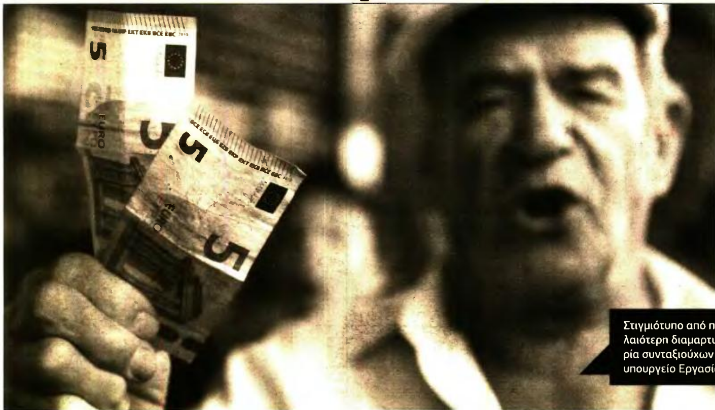
Στιγμιότυπο από παλαιότερη διαμαρτυρία συνταξιούχων στο υπουργείο Εργασίας