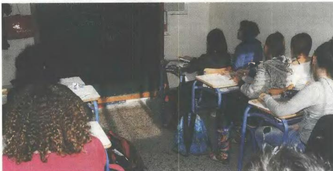
Το κολατσιό περιλαμβάνει ένα σάντουιτς ή μία τυρόπιτα και χυμό, ενώ η διανομή του γίνεται με μεγάλη διακριτικότητα, ώστε να προστατεύονται τα παιδιά. ΦΩΤ. ΑΡΧΕΙΟΥ

Κολατσιό στο σχολείο, ώστε να καλυφθούν οι ανάγκες περίπου 1.400 μαθητών που προέρχονται από οικογένειες με χαμηλά εισοδήματα, θα αρχίσει να προσφέρει μέσα στο επόμενο διάστημα ο δήμος Θεσσαλονίκης. Σύμφωνα με τον αρμόδιο αντιδήμαρχο Κοινωνικής Πολιτικής και Αλληλεγγύης Πέτρο Δεκάκη η προσφορά του λεγόμενου δεκατιανού, που εντάσσεται μέσα σε ένα ευρύ πλέγμα κοινωνικών δράσεων του δήμου, αναμένεται να ξεκινήσει από την επόμενη κιόλας εβδομάδα.